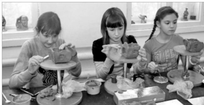
Воспитанники художественной школы за работой.