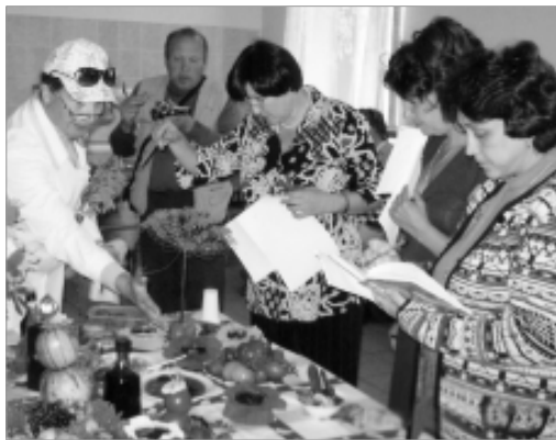
Жюри за "вкусной" работой.

А еще в Билимбае обнаружили ... инопланетяне. Как выяснилось, космические гости в деревне питаются вареньем из роз и одуванчиков, рецептами которых они поделились с вра-