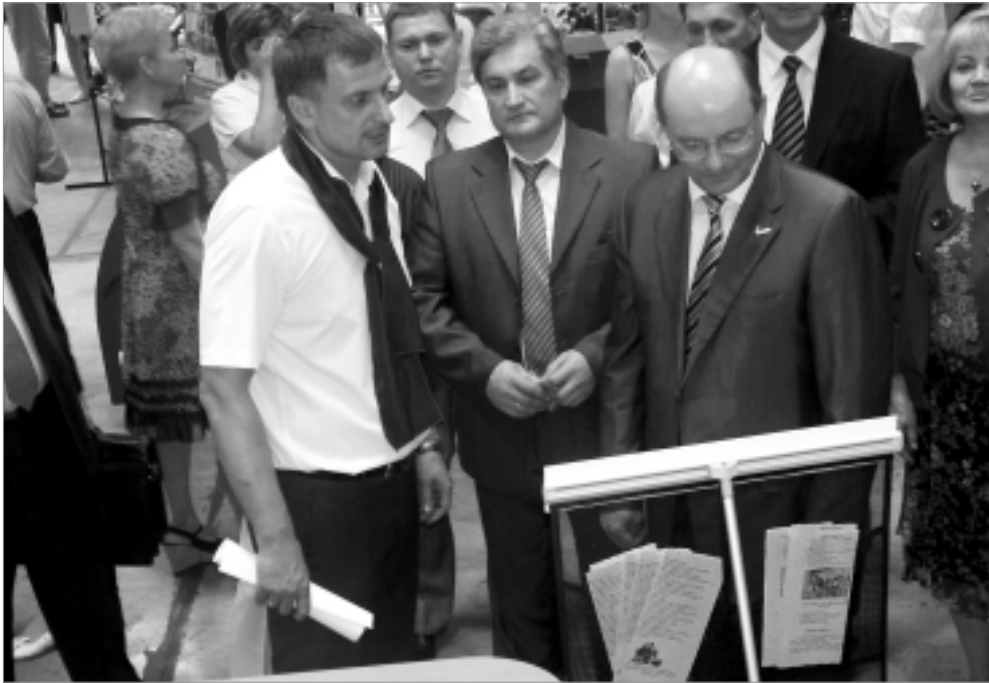
Фото Юлии РАМИЛЬЦЕВОЙ.

Департамент информационной политики губернатора Свердловской области.