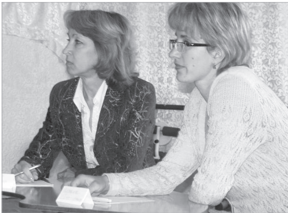
Учителя начальных классов школы № 22 - участники "круглого стола".

Оцениваться выпускник начальной школы будет не только по предметным, но и по метапредметным, а также личностным достижениям.