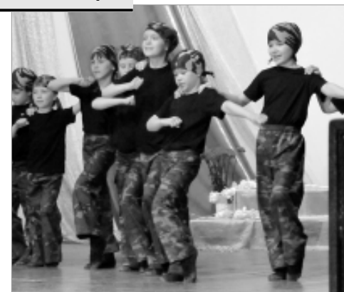
Концерты военной тематики стали для "Авиатора" традицией.