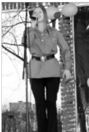
Хористы "Сольвейга" выступили в ПКЮ.

Активное участие в праздновании годовщины Победы принял и оркестр ДКиТ ОАО "ПНТЗ" "Серебряные трубы". Музыканты порадовали собравшихся на митинге у Вечного огня возле центральной проходной Новотрубного завода. Создали по-настоящему праздничное настроение у участников и зрителей парада, прошедшего на площади Победы. А после на площадке перед Дворцом культуры и техники состоялся концерт оркестра. Звучит труб, саксофонов и труб отзывались в душах первоуральцев радостью: становилось понятно, что живая духовая музыка способна