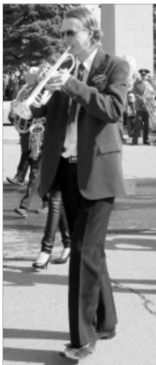
"Серебряные трубы" прошли по площади Победы.

придать любому празднику яркость и торжественность.