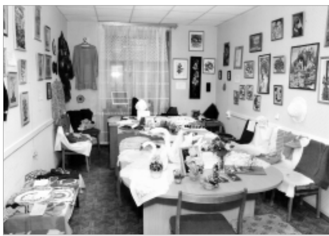
И в просторной комнате выставке было тесно.