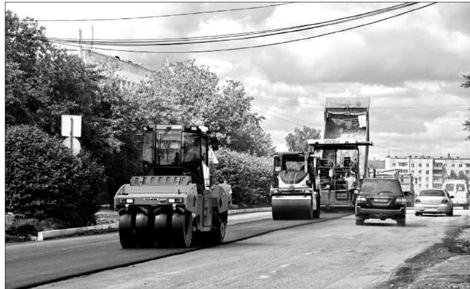
В материале использована информация пресс-службы главы городского округа Первоуральск