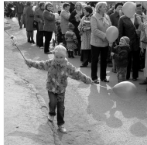
Дети искренне радовались празднику.