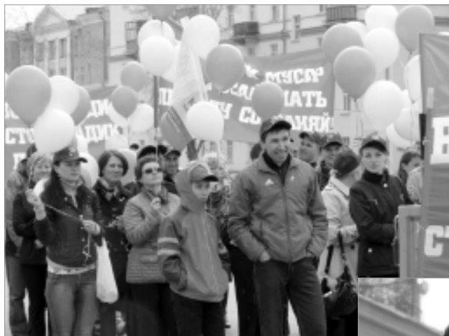
Первомайские колонны были оформлены ярко и разнообразно.

С 20 до 22 часов - праздничный концерт творческих коллективов города.