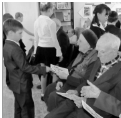
Школьники вручили ветеранам собствен-но сделанные открытки.