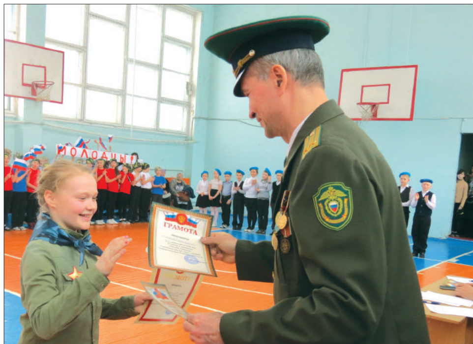
Участников и победителей смотра-конкурса наградили дипломами и грамотами

Теперь эти ребята — в основном составе ансамбля и успешно выступают на многих конкурсах и фестивалях. В прошлом году, например, ездили в Испанию, представили русскую культуру участникам международного фестиваля-конкурса.