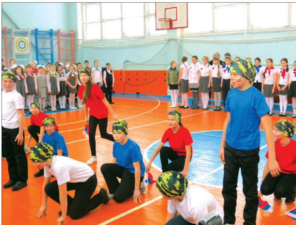
Момент выступления. Ребята подготовились основательно, даже продумали специальную форму для выступлений.