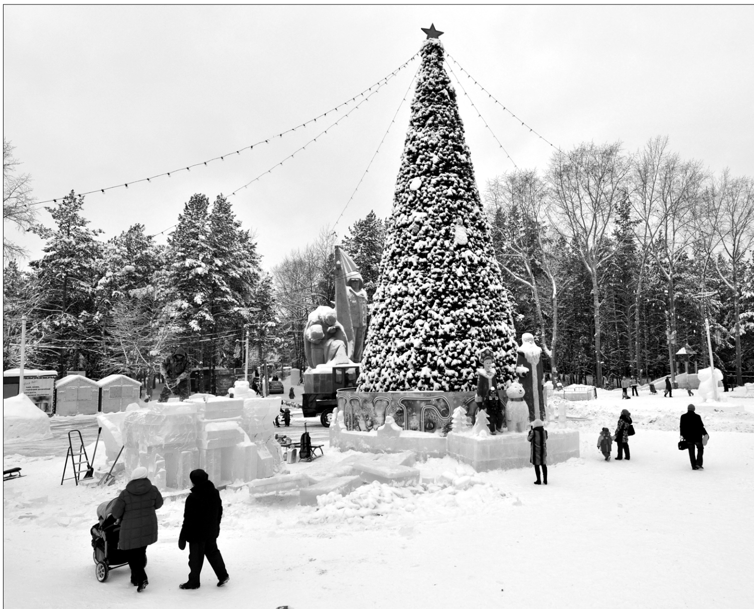
В парке установлена красавица елка. Дед Мороз, Снегурочка и мишка-олимпиец рядом.

Поздравить любимых людей с днем рождения и юбилеем, продать, обменять или купить, подарить, найти - все это можно сделать через нашу газету "ВП". Мы всегда вам рады.