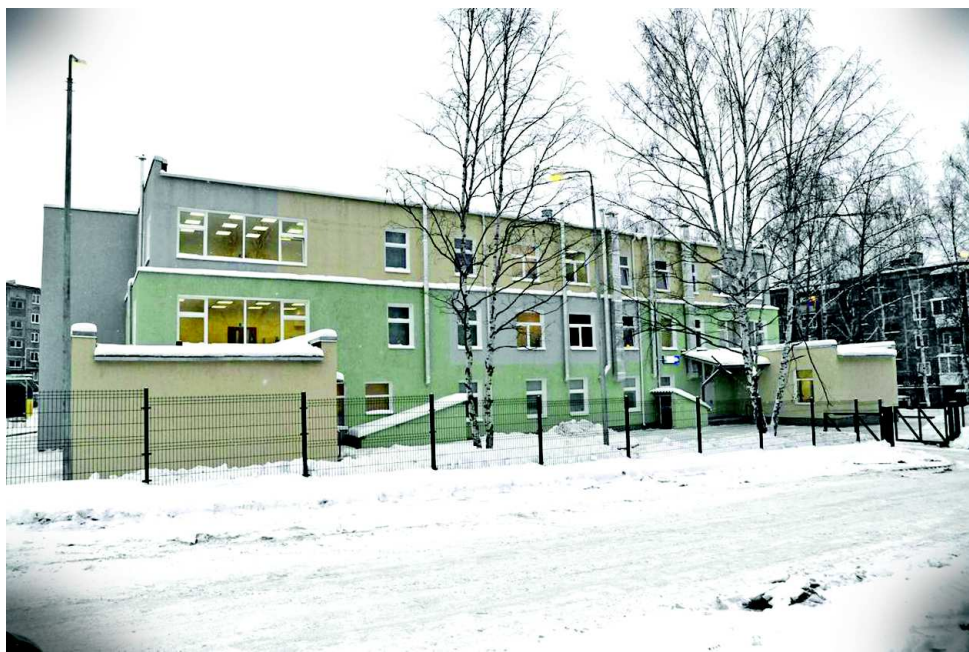
Усовершенствованный детский сад № 1. Скоро открытие.

дов. Разрисованные стены не могли не броситься в глаза.