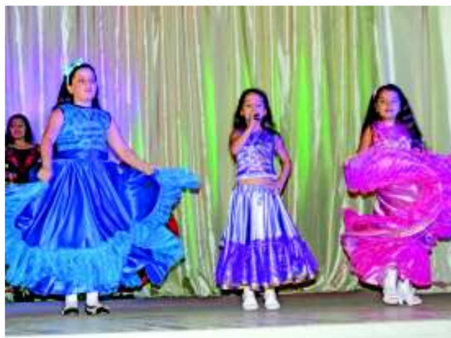
Студия цыганской культуры "Джипси-арт".

- Всего самого доброго и до встречи в следующем году!