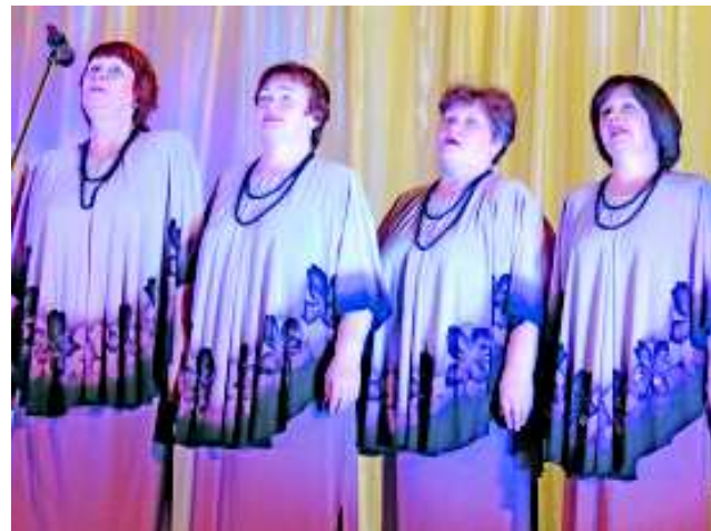
Коллектив "Белая сирень".

Еще одним открытием фестиваля стал коллектив "Джипси-арт". Студия цыганской культуры в ДК Ленина появилась ле-