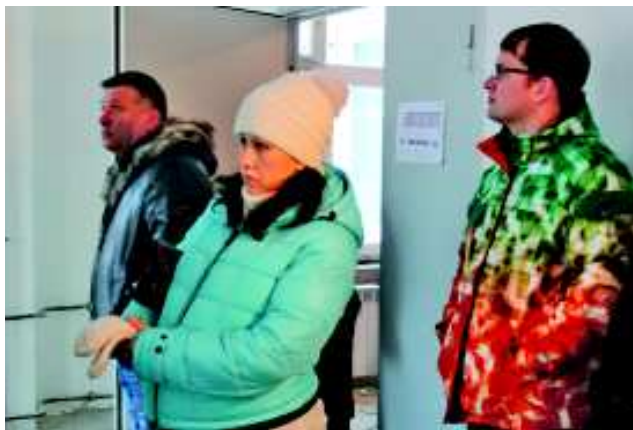
Члены родительского комитета в строящемся детском саду на улице Ватутина.

Представители родительских комитетов будут напрямую взаимодействовать с Управлением капитального