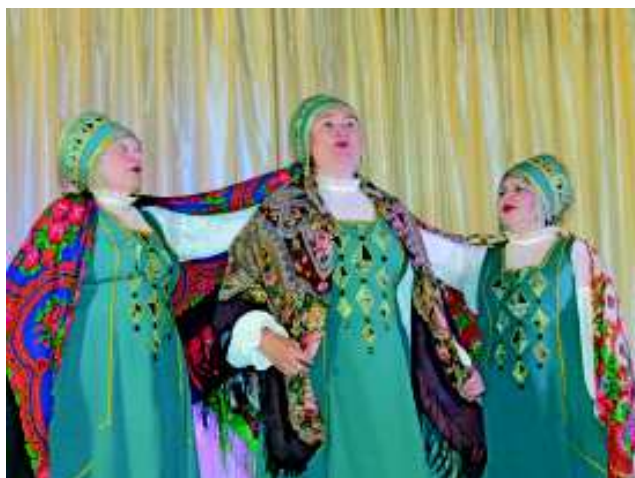
Хор русской песни имени И. Матвеева.