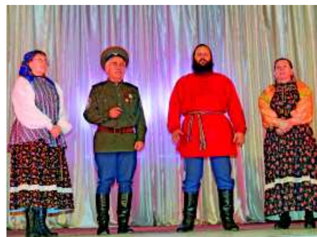
Фольклорный семейный казачий ансамбль "Воля".