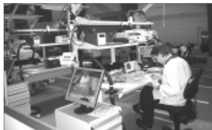
Рабочее место монтажника.