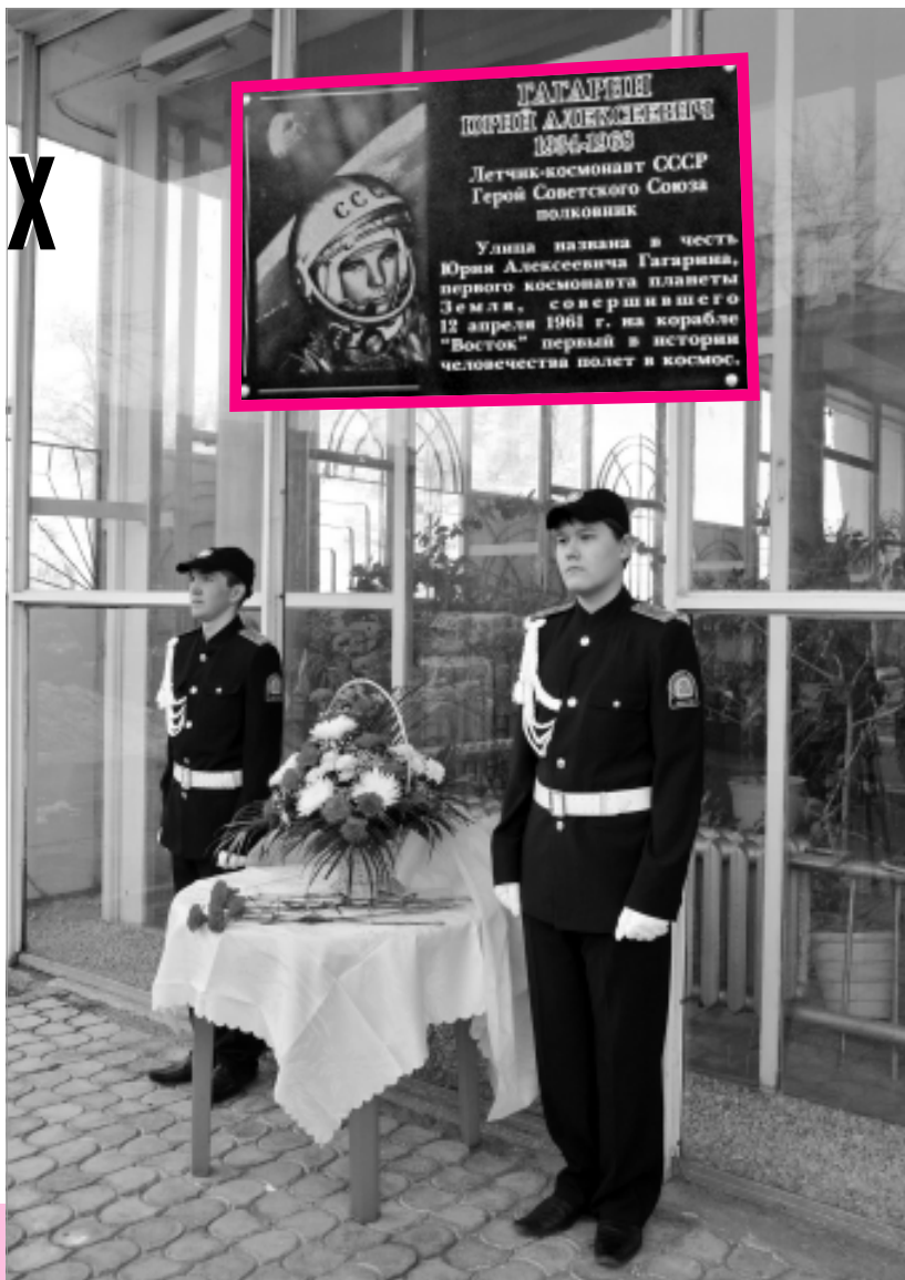
Момент митинга. В почетном карауле кадеты (школа № 3).