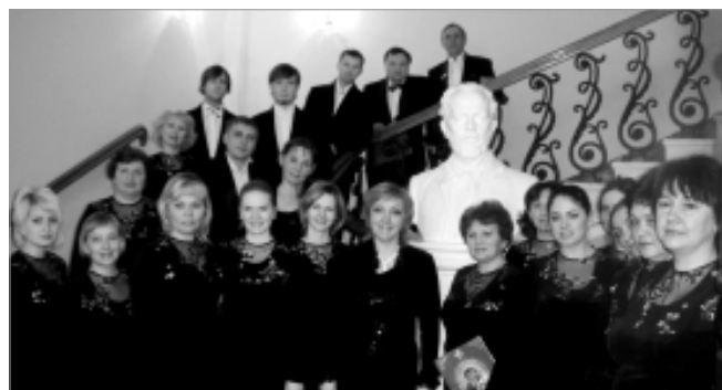
Первоуральский академический хор "Сольвейг".