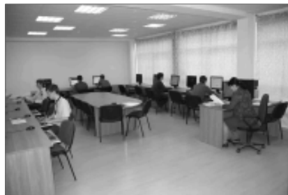
Лаборатория систем баз данных.