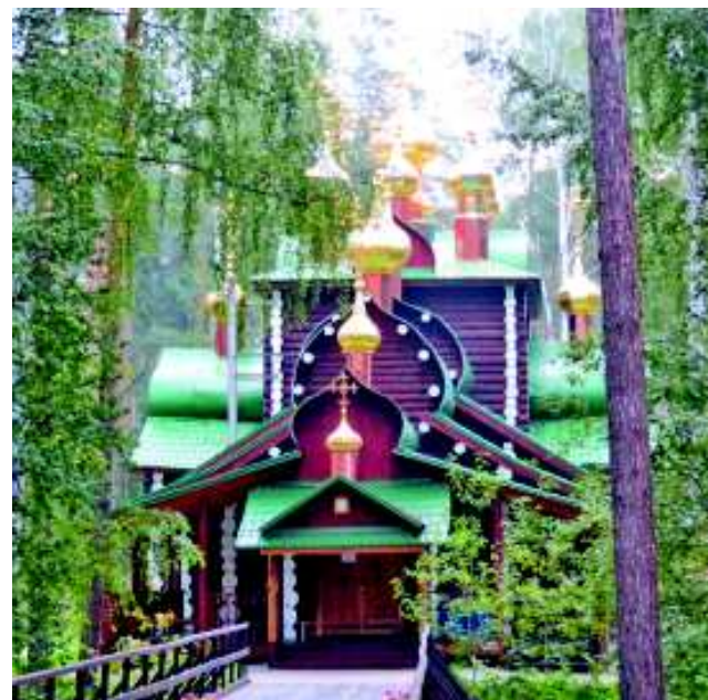
Ганина Яма - 7 храмов, по числу убитых Романовых.

После смерти мужа, Сергея Александровича, Елизавета посвятила себя служению ближним. Она создает и становится настоятельницей Марфо-Мариинской обите-