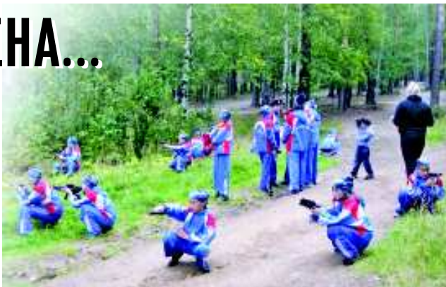
Спецназовцы заняли круговую оборону.

Все задания были зашифрованы. Чтобы решить ребус или шараду, требовались знания в области географии, истории, ан-