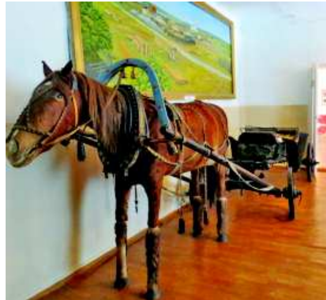
Верхнесинячихинский музей. Эта лошадь когда-то работала на местном заводе.