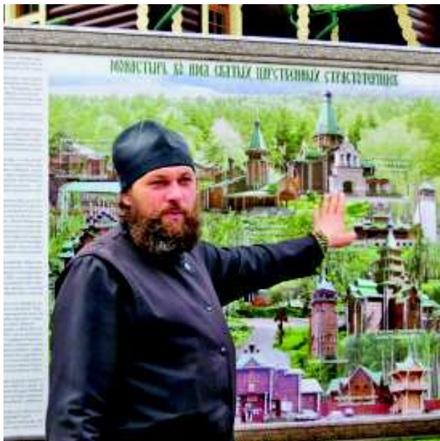
Экскурсию проводят наместники и служители монастыря.

"Вечерка" предлагает по-новому взглянуть на уральский туризм - и отправиться по местам, интересным для обывателя, полезным для любителей истории и значимым для верующих.