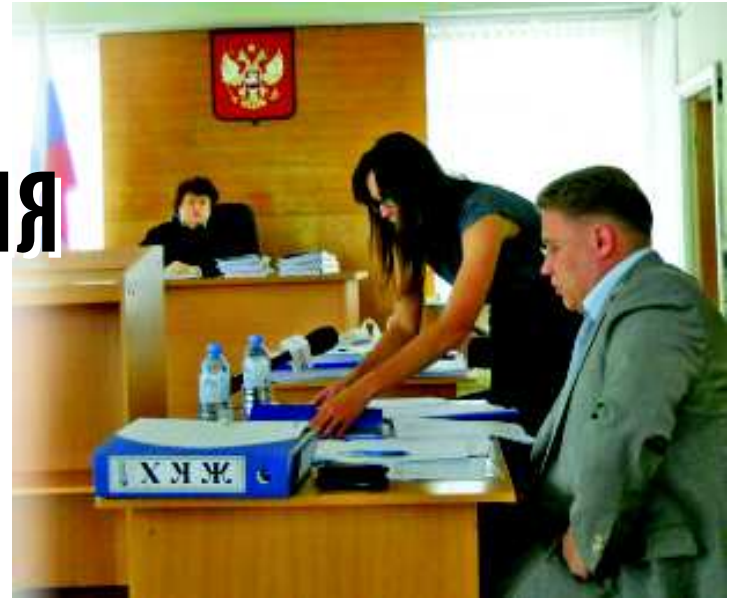
В этой папке на краю стола документы, которые подтверждают: Глава не бездействовал.