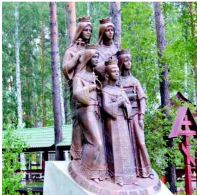
Ганина Яма. Цесаревич Алексей, царевны Ольга, Татьяна, Мария и Анастасия.