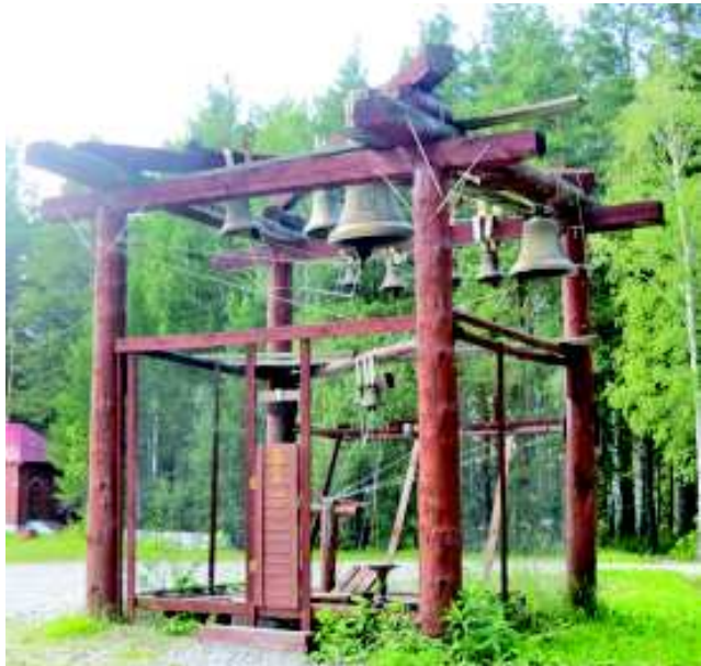
Колокольня в окрестностях шахты на Межной.

По дороге к месту расположения некогда заброшенных шахт мало кто обращает внимание на скромный мемориал - православный крест и два памятных камня. А зря, ведь именно здесь, в Поросятковом логу, и были найдены останки Романовых. Согласно исторической хронике, через два дня после убийства тела членов царской семьи и приближенных решили перепрятать. Останки подняли из шахты и повезли в неизвестном направлении.