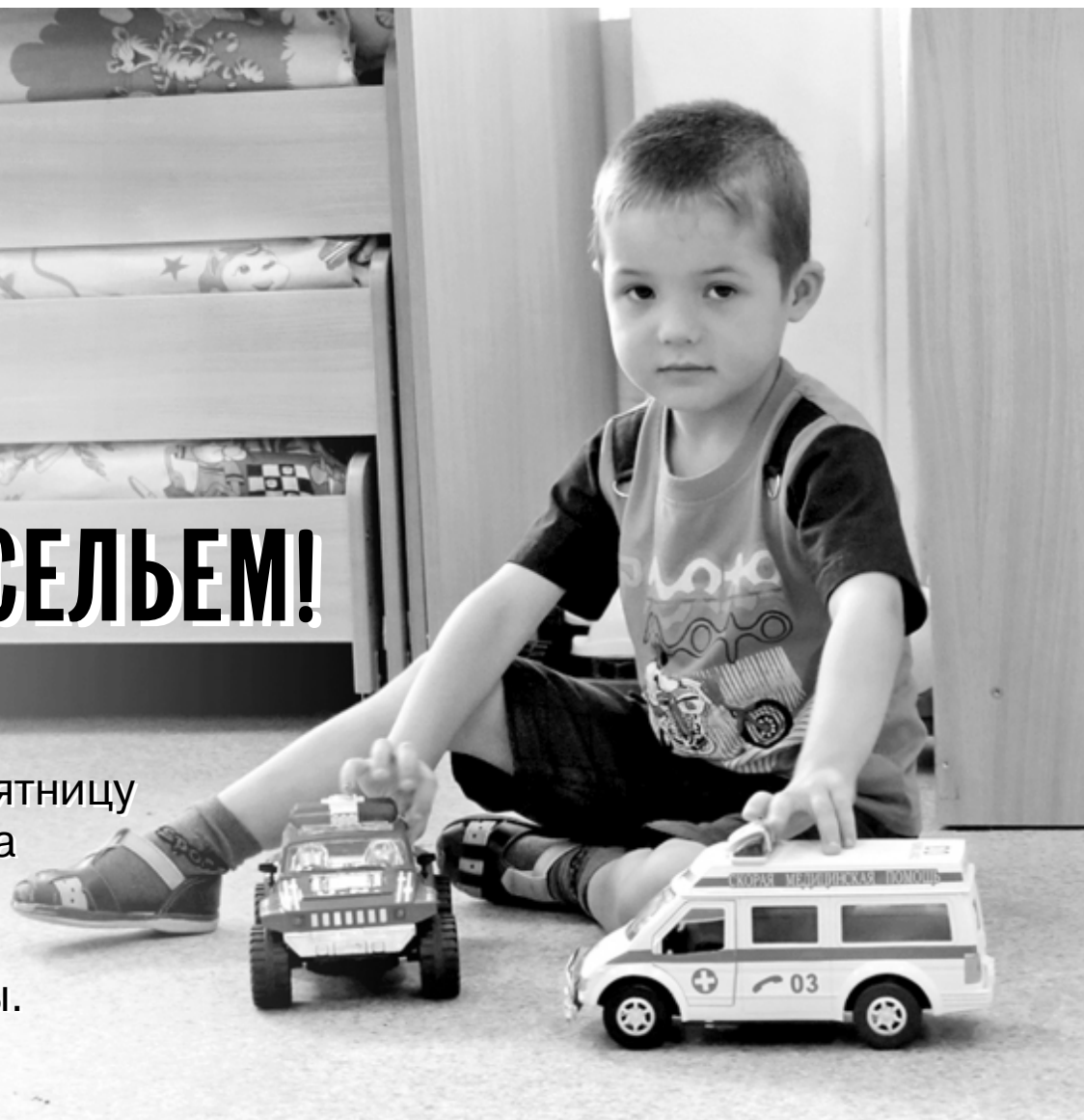
В новую логопедическую группу пойдут 12 маленьких жителей Битимки.

В минувшую пятницу в селе Битимка исчезла очередь в детские сады.