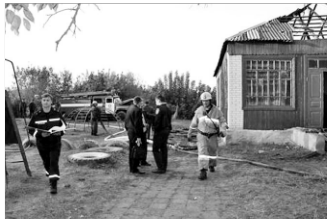
Тушение огня в частном секторе.

Отдел МВД России по городу Первоуральску.