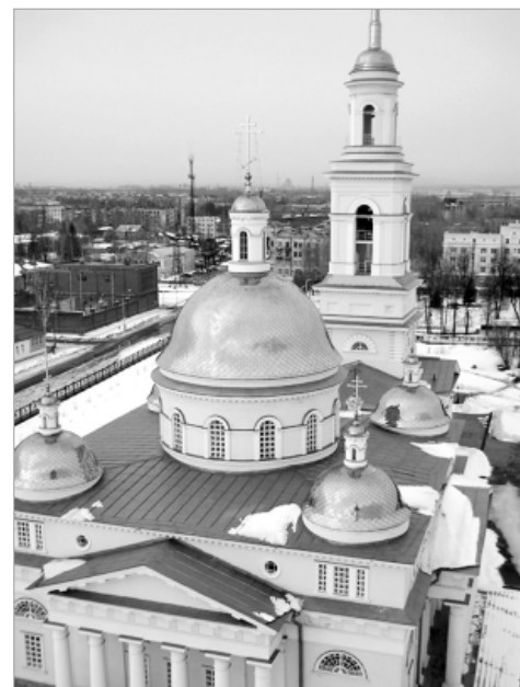
Вот так выглядит Спасо-Преображенский собор со смотровой площадки башни.

Верхние Таволги - территория Невьянского завода художественной керамики, Нижние - по сути, вотчина семейного биз-