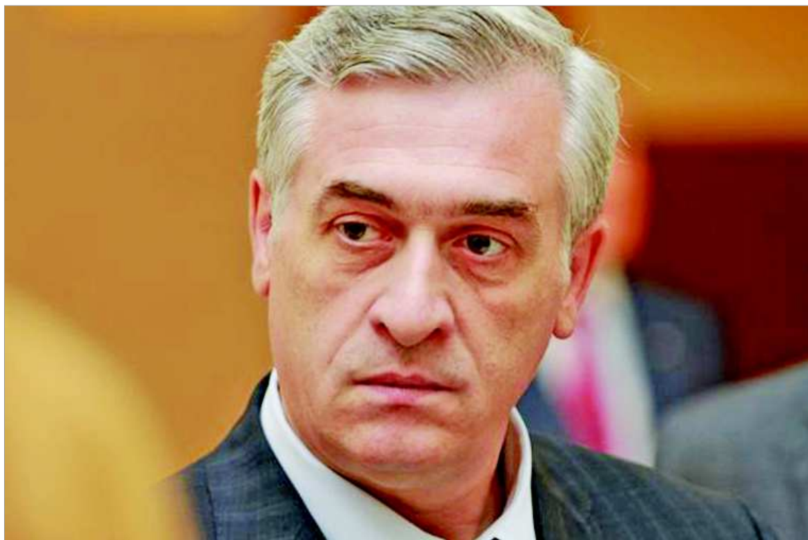
Вице-губернатор Яков Силин.

По вопросам определения территории для проведения субботника, предоставления мешков под мусор и вывоза собранного мусора обращаться в организационный отдел Администрации городского округа Первоуральск (64-94-55, 64-98-12).