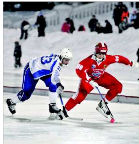
"Уральский трубник" - единственная команда, представляющая Средний Урал в российской Суперлиге.