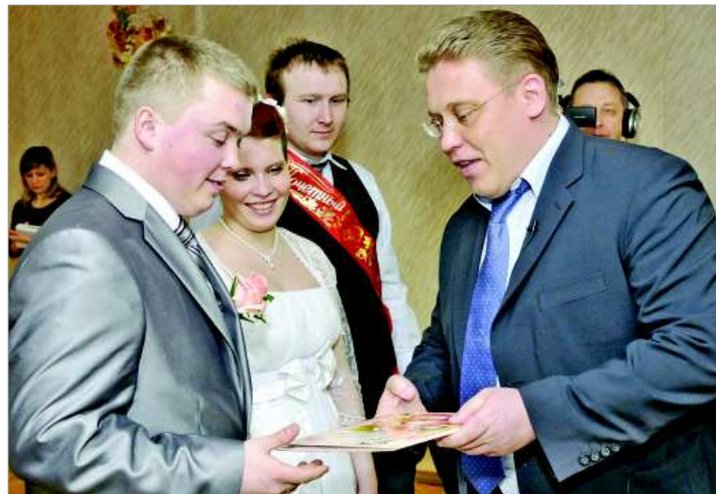
Глава поздравляет молодоженов.