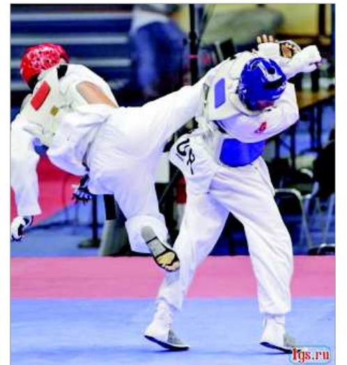
Тхэквондо - в числе приоритетных для Первоуральска видов спорта.