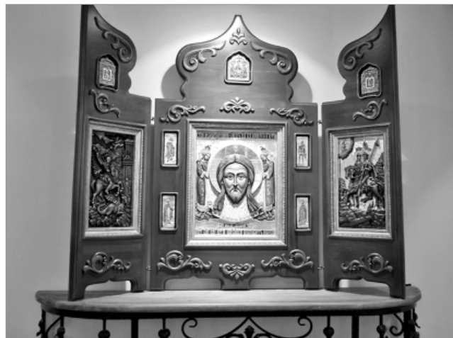
В зале частного музея "Дом Невьянской иконы".