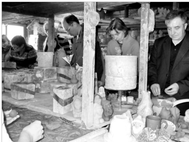
Подарок на память о таволожских гончарах своими руками.