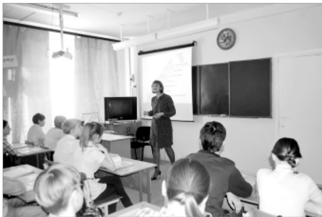
На открытом занятии.