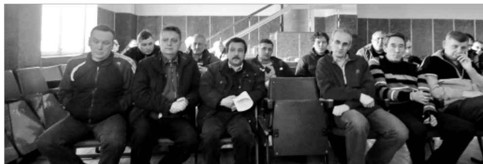
Водители транспортного предприятия прослушали беседы.

ГИБДД г. Первоуральска.