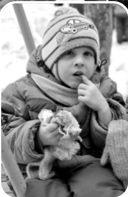
Лучшее лакомство на Масленицу - блины.