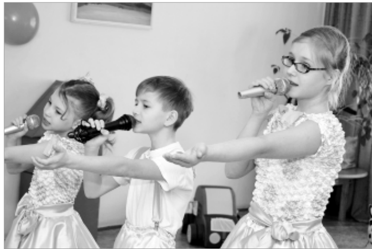
"Ириски" на сцене.