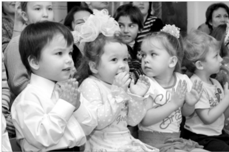
Маленькие зрители довольны.