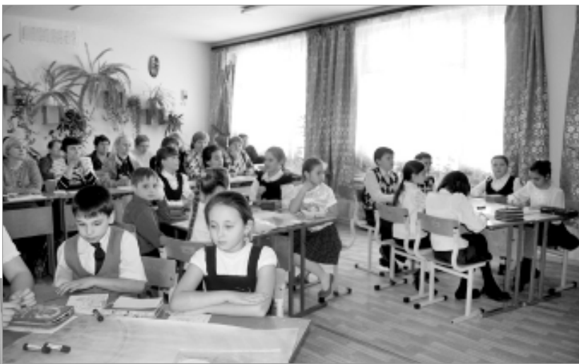
Творчество - закономерный результат одаренности.