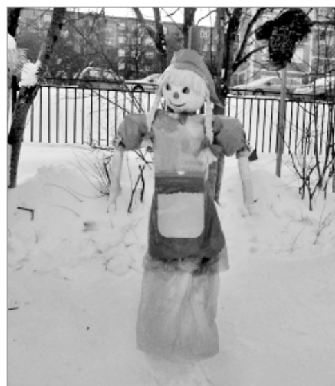
... и даже мультяшную Машу.