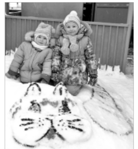
Вот это кот!