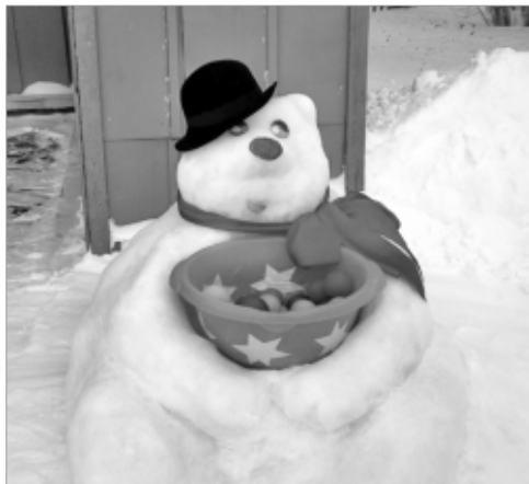
На участках можно увидеть и медведя...

Прогулка для дошколят - всегда праздник, а зимняя прогулка - радость двойная! Чтобы дети не мерзли на морозе, они должны быть заняты интересным делом. Для этого педагоги детских садов занимаются оформлением территории. Малыши знают: как только выпадает снег, участки превращаются в сказочную страну, которую населяют персонажи любимых сказок.