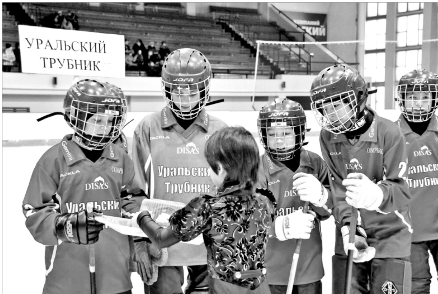
Открытие турнира. Хлеб с солью заменил торт. Команда "Уральский трубник-2" пока не знает, что станет бронзовым призером.

Предварительная запись по телефону 64-96-19.