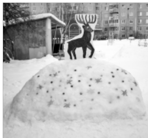
... и оленя.

В МКДОУ "Детский сад № 3" прошел традиционный смотр - конкурс прогулочных участков.