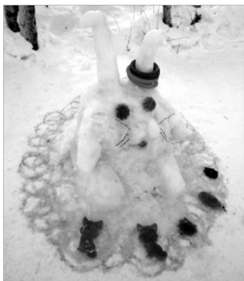
... и зайчика