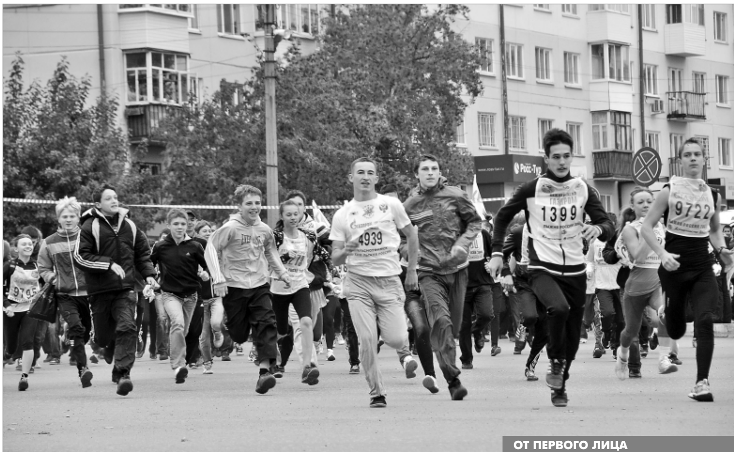
Молодежь - оплот самого массового мероприятия страны.

Предварительная запись по телефону 64-96-19.