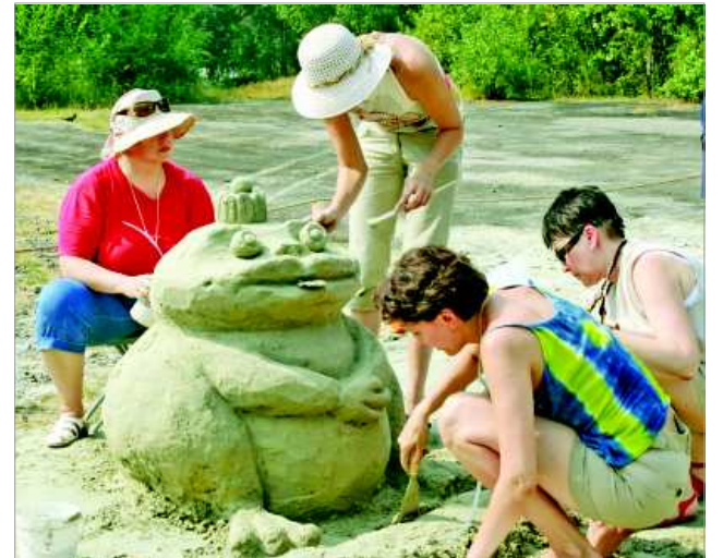
Эх, такой Царевне только Ивана-царевича не хватает!