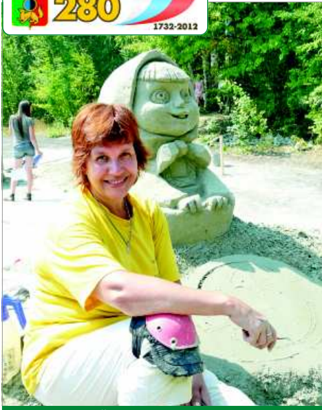
НЕ ТРОГАЙТЕ МАШЕНЬКУ!