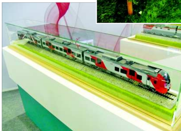
Макет нового электропоезда.

Нынешняя выставка в Екатеринбурге, по сравнению с прошлогодней, оказалась гораздо лучше организованной. Стенды предприятий-участников объ-