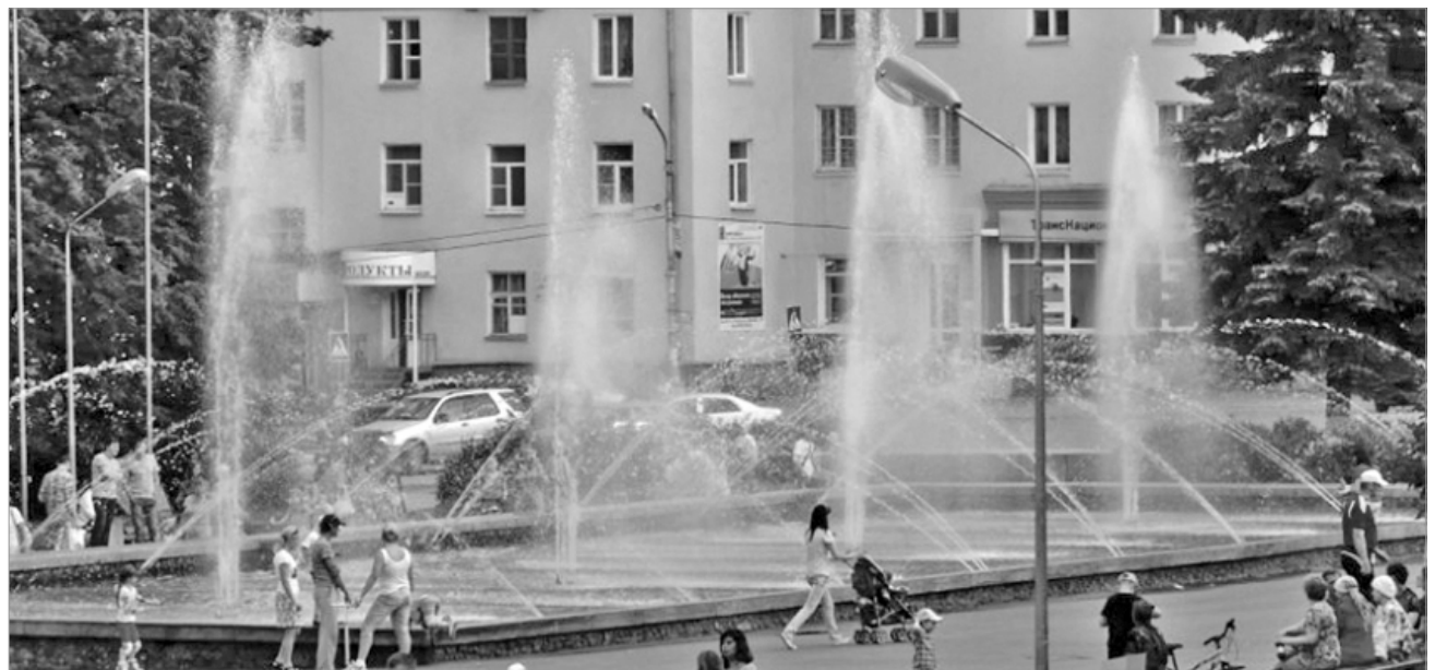
Городской фонтан - любимое место отдыха.

26 ИЮЛЯ Центр "Осень". 11 часов - беседа "Первоуральск поэтический". Клуб поселка Прогресс. 18 часов - музыкально-развлекательная программа "Мир вокруг нас". Муниципальный выставочный центр (улица Вайнера, 15). 18 часов - музыкальная гостиная.