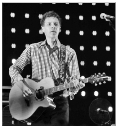
Роберт Ленц, солист группы "Браво".