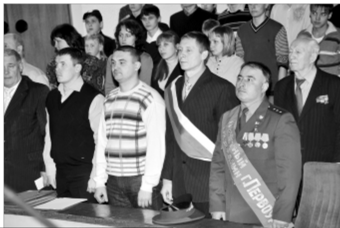
Во время исполнения гимна.

В понедельник в ДК ОАО "ПНТЗ" состоялось торжественное городское собрание в честь Дня защитника Отечества. В зале по соседству с ветеранами сидели воины-интернационалисты, ребята из патриотических клубов... Вот она, преемственность поколений, которой посвящен праздник.