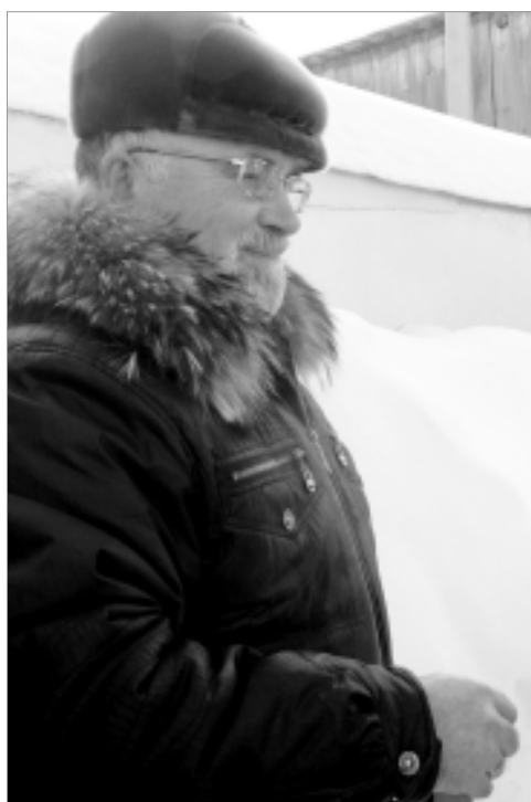
Да будет газ!

Наши телефоны: 24-85-74; 24-69-75; 24-80-97.