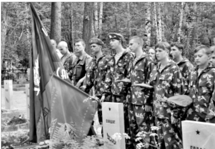
Ребята из клуба "Саланг".