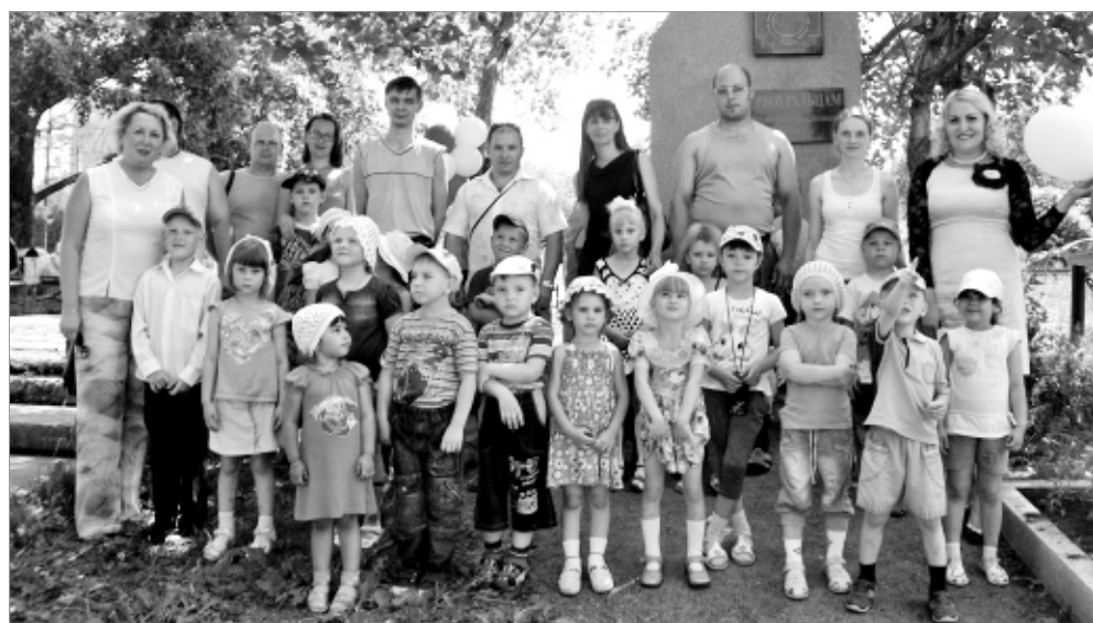
Педагоги, дети и их родители - участники акции.