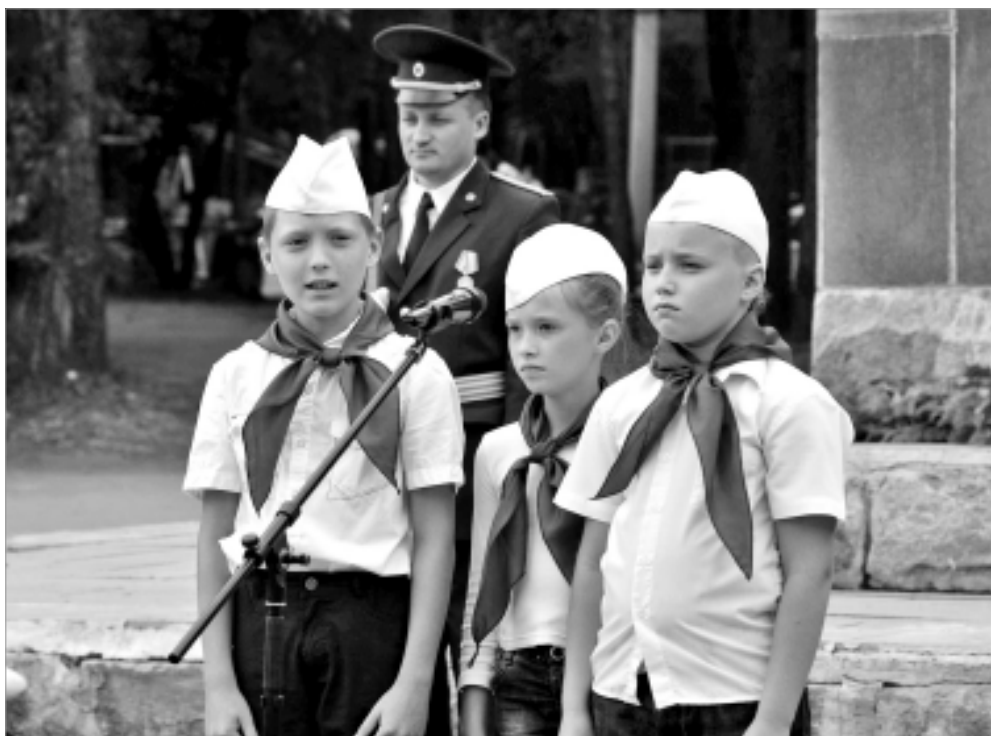
"Подвиги героев - пример для нас", - утверждают дети из школы № 4.