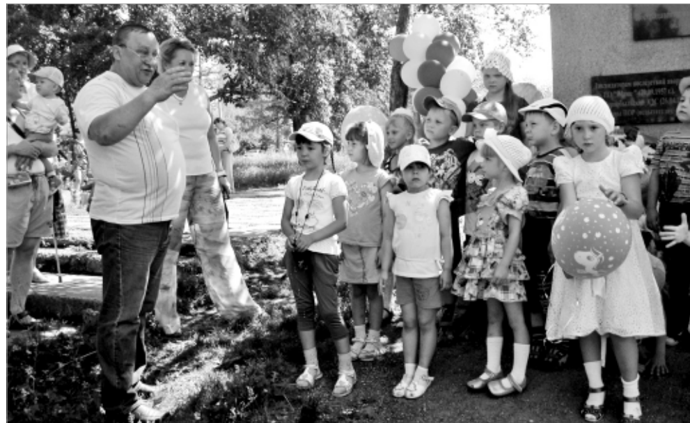
Взрослые с удовольствием слушали выступления ребят.