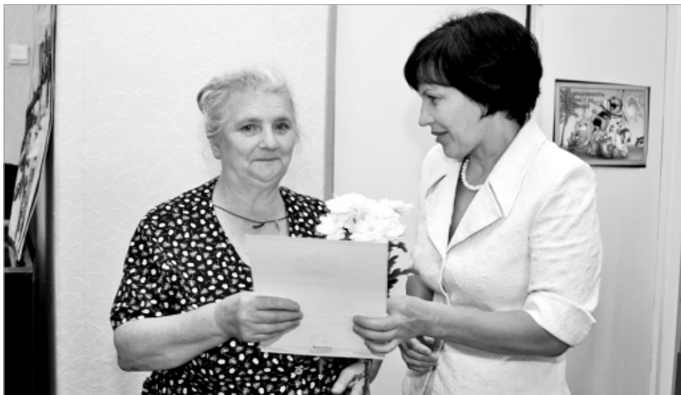
Многие социальные работники Первоуральска отмечены почетными грамотами городского управления и областного министерства соцзащиты населения, в также благодарственными письмами правительства Свердловской области.