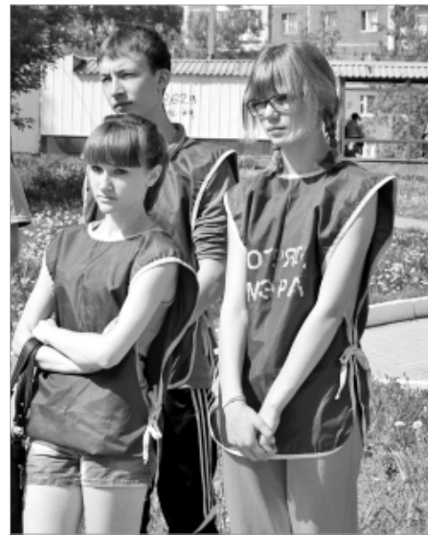
220 ребят за лето будут трудоустроены в отрядах мэра. Они не только заработают на карманные расходы, но и приведут город в порядок.