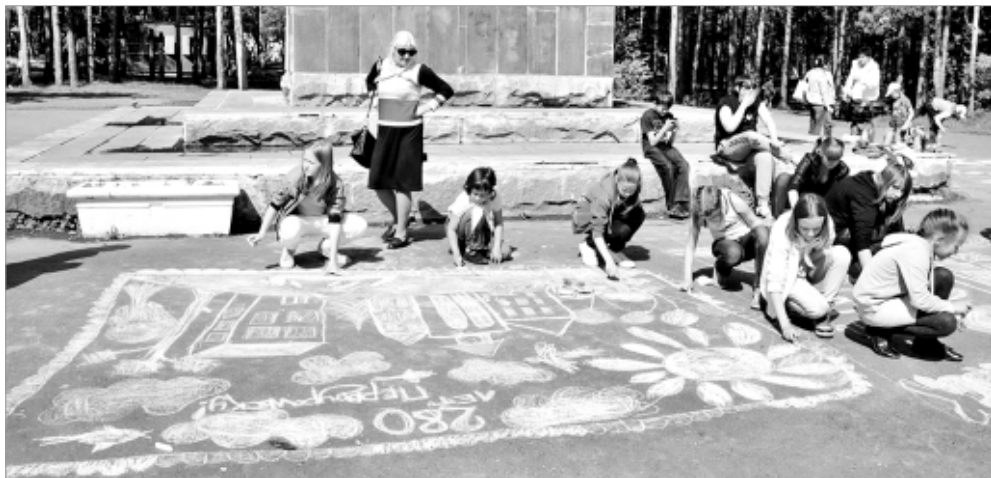
Это полотно - посвящение своей малой родине. С юбилеем, город!