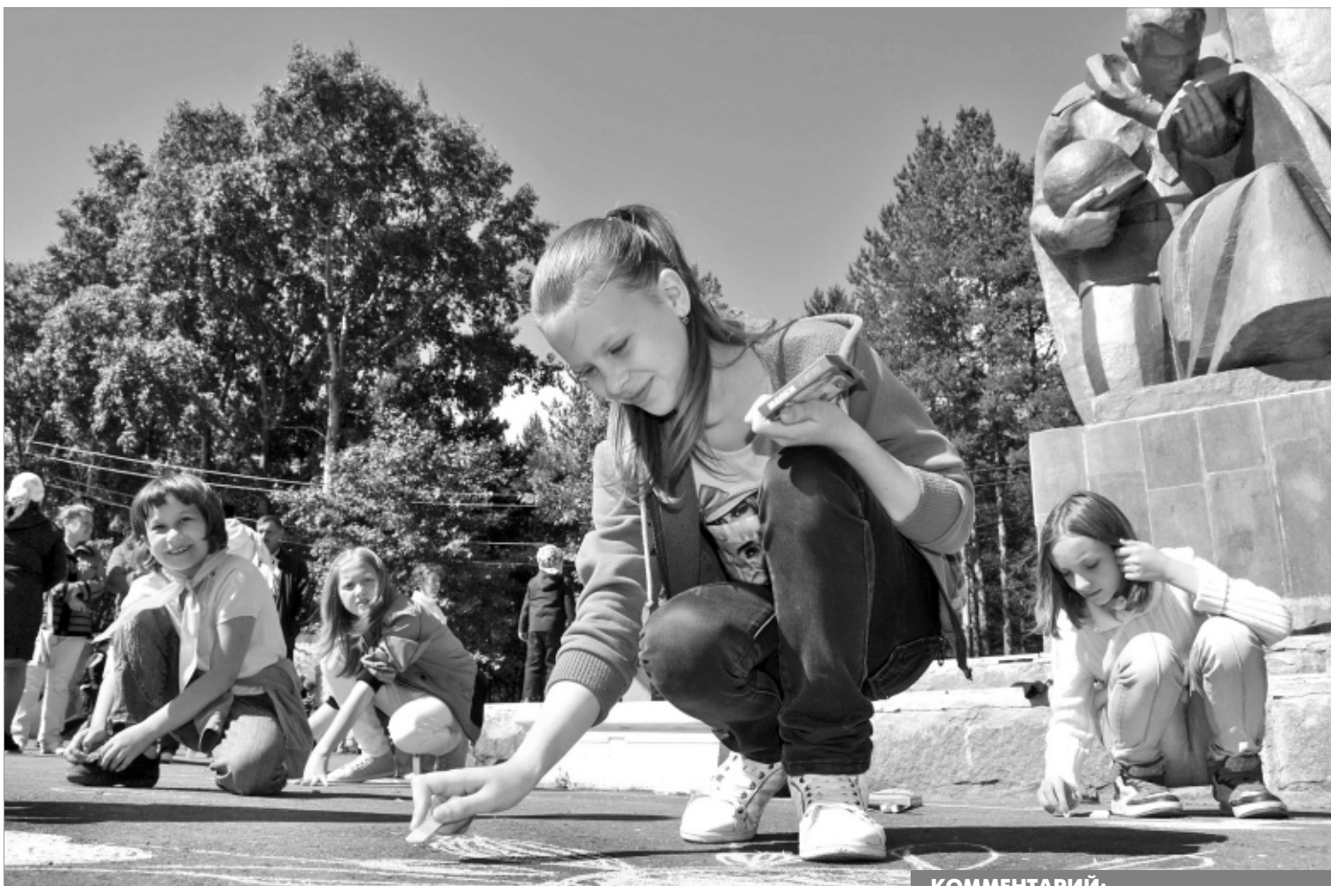
"Солнечный круг, небо вокруг..."