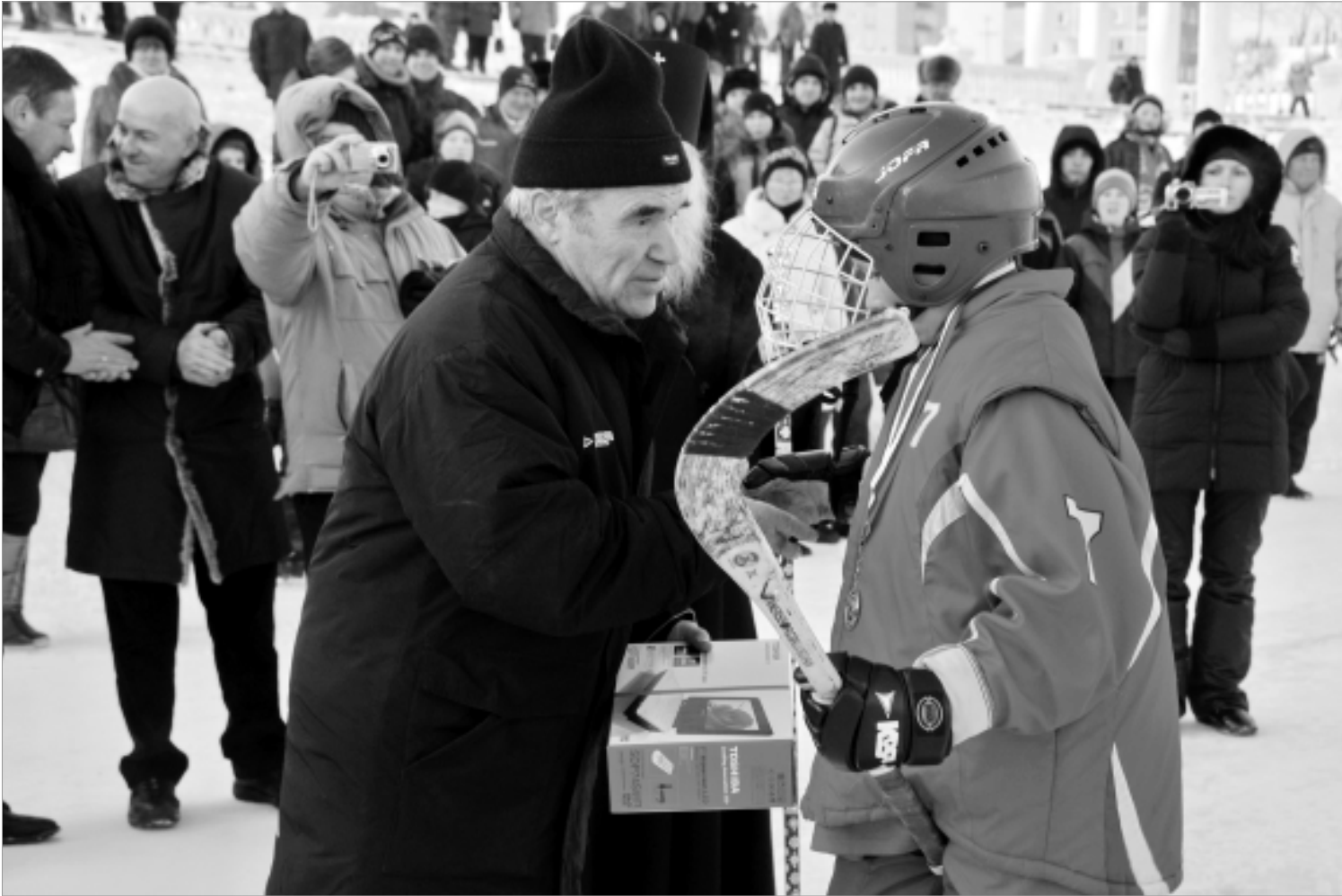
Звезда мирового бенди Николай Дураков вручает награду юному хоккеисту.