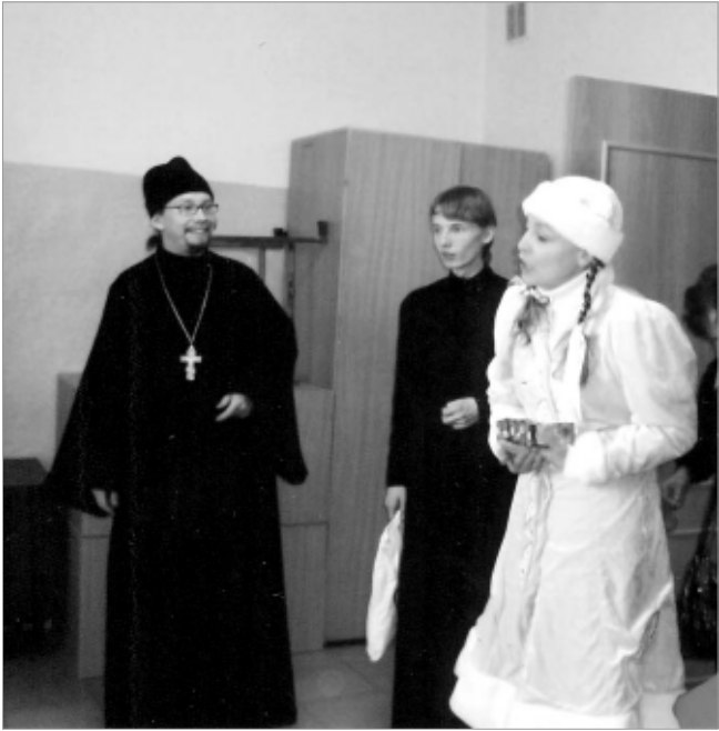
Гости в психоневрологическом интернате.