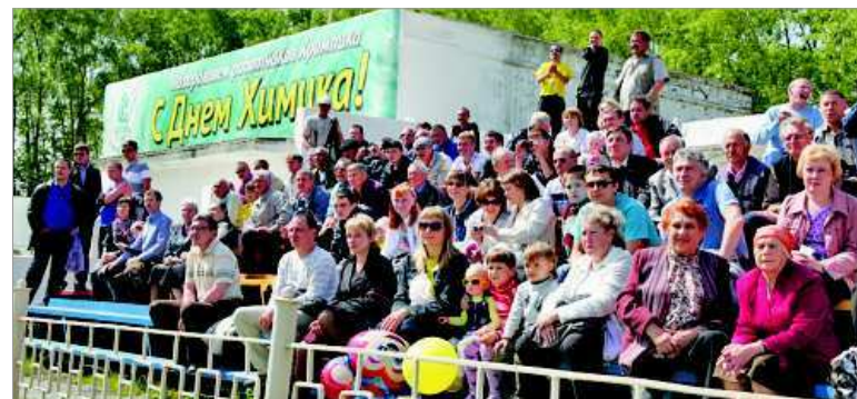
Зрители заполнили трибуны стадиона.

От имени партнеров хромпиковцев тепло поздравил с праздником