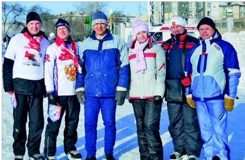
Февраль 2012 года. На стадионе "Уральский трубник".