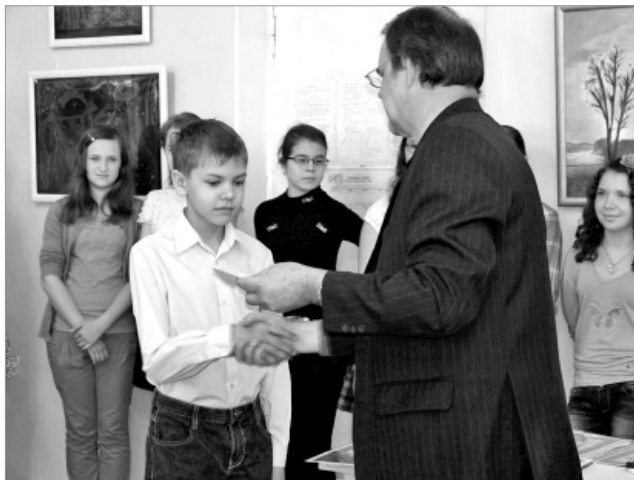
Вручение заслуженных наград.

Первоуральцы приняли участие в Международном фестивале детского творчества.