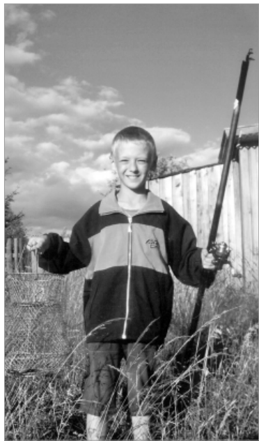
Рыболов из Прогресса.

Сотрудники Централизованной библиотечной системы провели конкурс, приуроченный к 280-летию Первоуральска. Тема - «Край родной, навек любимый».