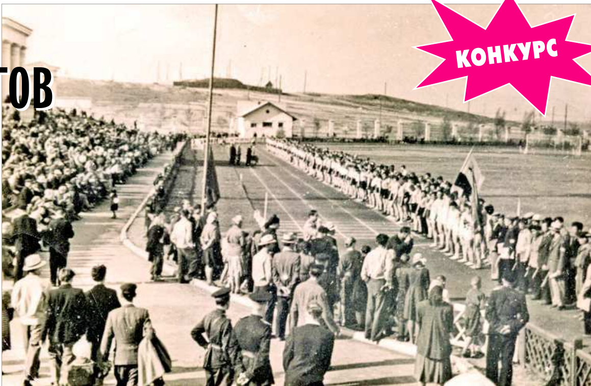
Стадион новотрубников стал центром спортивной жизни города.

Прибавил праздничного настроения на переполненных трибунах парад физкультурников. Открыли его, держа в руках зна-