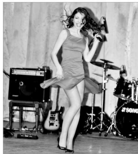
Солисты "Сцены" зажигают.