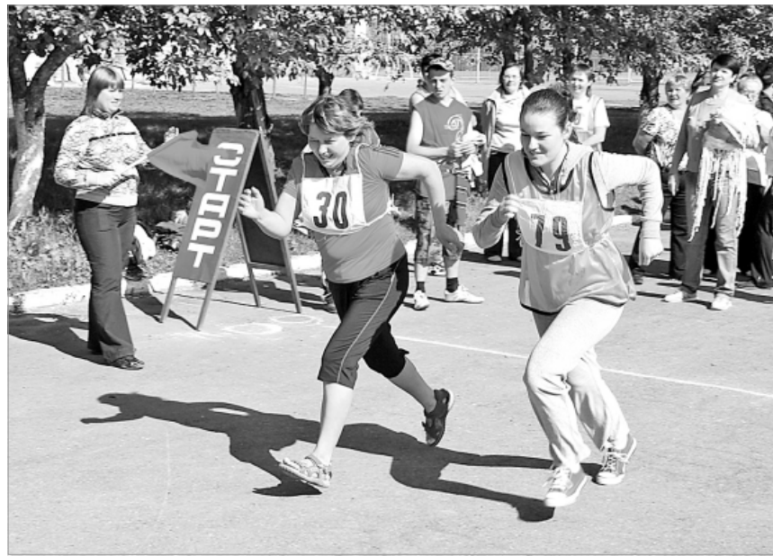
Вперед, за личными рекордами.