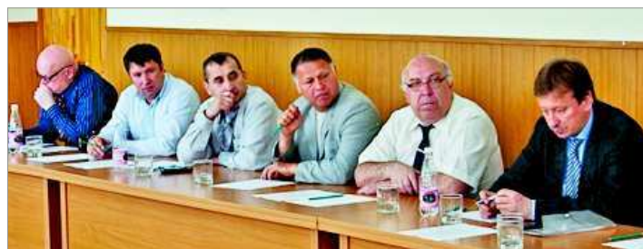
Участники встречи в зале заседаний Администрации.