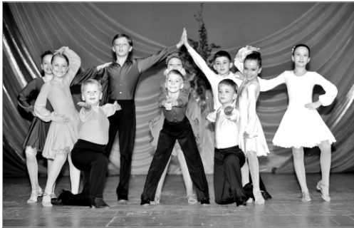
На сцене - юные танцоры из "Кристалла".