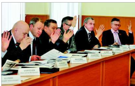
Депутаты за работой.

Еще одна проблема, которую обозначили депутаты, - это нехватка педагогических кадров в детских садах и школах. Только в дошкольных учреждениях сегодня требуется 81 воспитатель. Нельзя ли эту проблему решить за счет устройства мам на должность воспитателя? Как показала практика, это не решает проблему, потому что родители, получив место в детском саду, в последующем уходят на другое место работы.