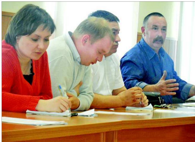
Члены Общественного совета на обсуждении.