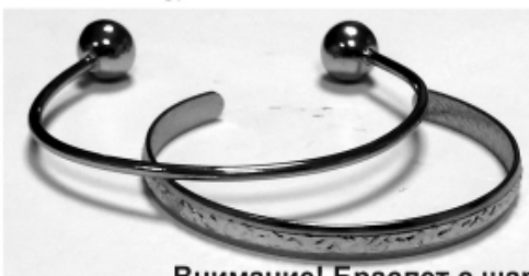
Внимание! Браслет с шариками обеспечивает дополнительную стимуляцию активных точек.

Цирконий — редкий металл серебристого цвета с легким золотистым оттенком. В медицине цирконий стал использоваться только во второй половине XX века. Из-за того что данный металл обладает бактерицидными свойствами и не отторгается организмом, из него начали делать зубные имплантаты, суставы и медицинские инструменты.