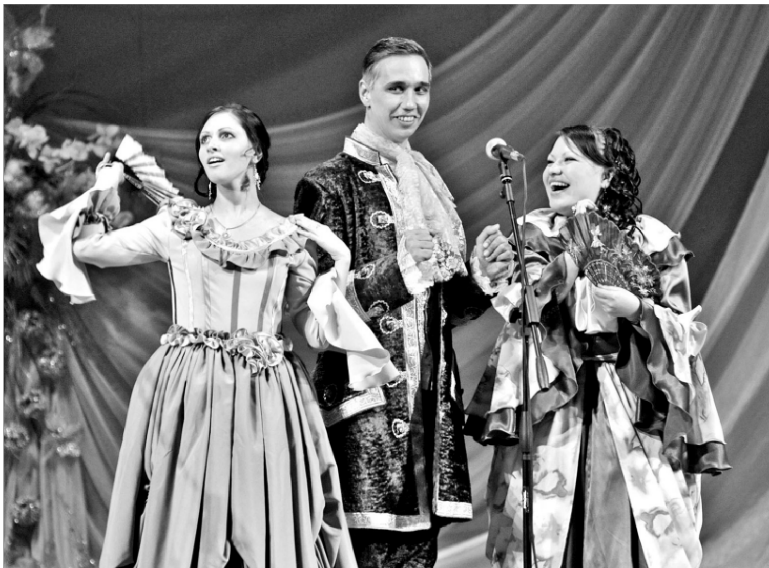
Артисты Первоуральского театра драмы и комедии на юбилейном концерте.