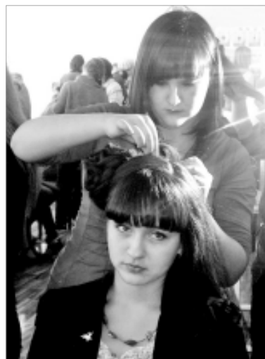
Мастер и модель.