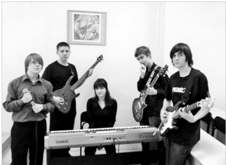
Музыканты "Out Of Distance".