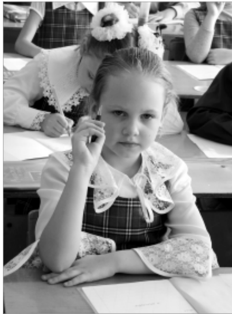
Первоклассники в этом году начнут учиться по-новому.

По всем вопросам, в том числе касающимся суммы долга и реквизитов для оплаты штрафов, обращаться в кабинет № 127 УВД Первоуральска либо по телефону: 27-04-54.