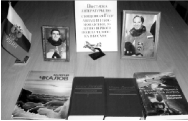
Экспозиция в горсовете ветеранов.