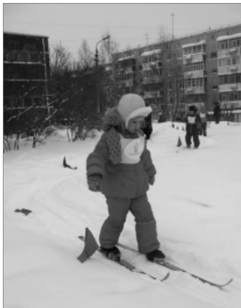
Кто лучший лыжник?

По официальным данным, после 1945 года в боевых действиях за рубежом, в том числе в Афганистане, принимали участие более чем в 30 локальных конфликтах около 1,5 миллиона соотечественников. Из них 25 тысяч человек погибли.