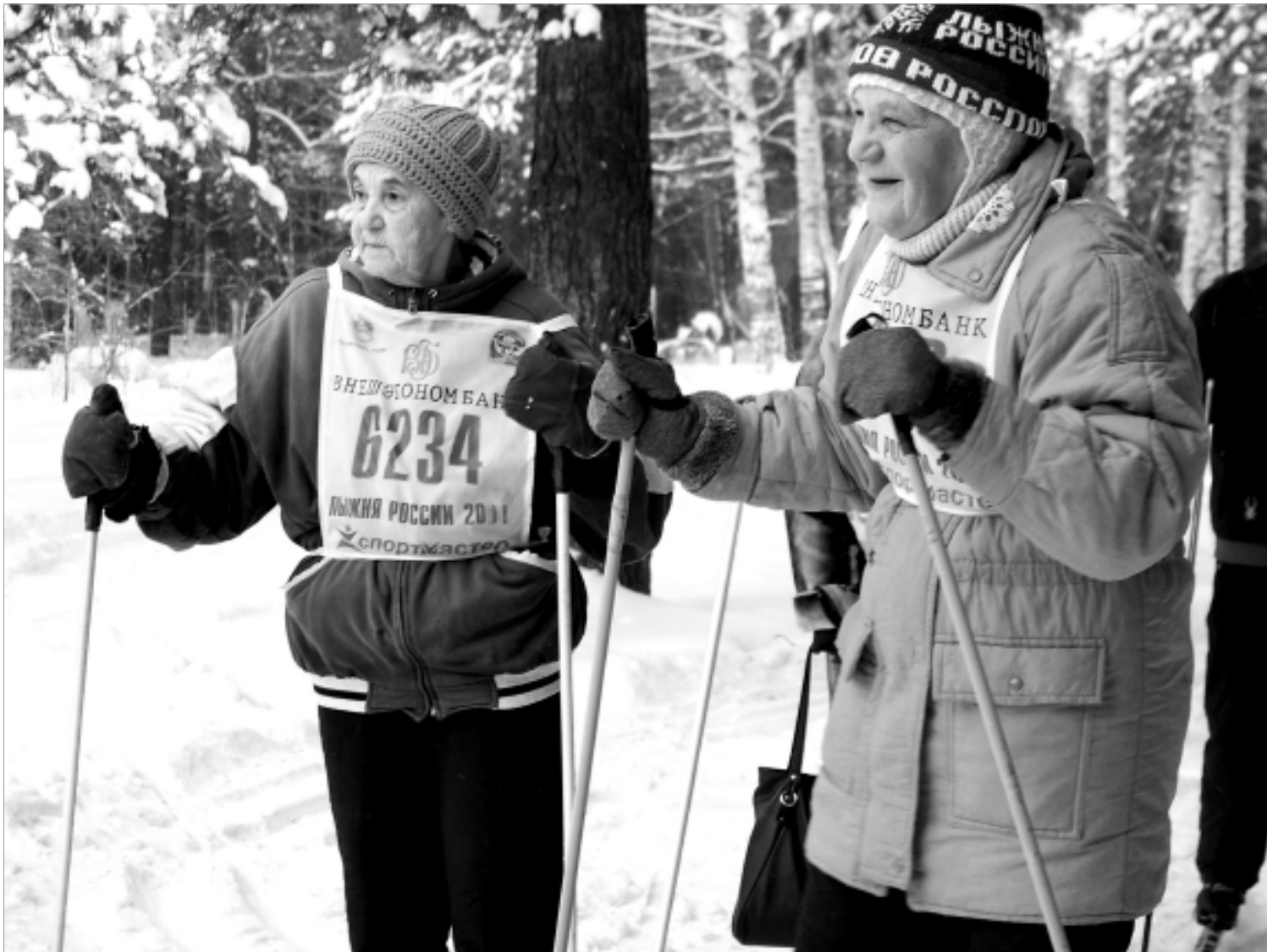
В "Лыжне России" приняли участие первоуральцы всех возрастов.