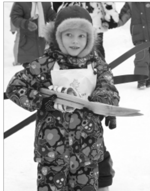
Дети с удовольствием встают на лыжи.