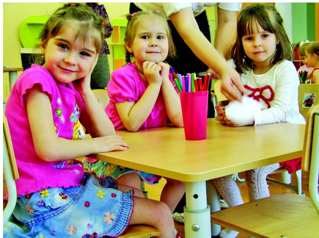
Теперь эти малыши могут посещать детский сад.