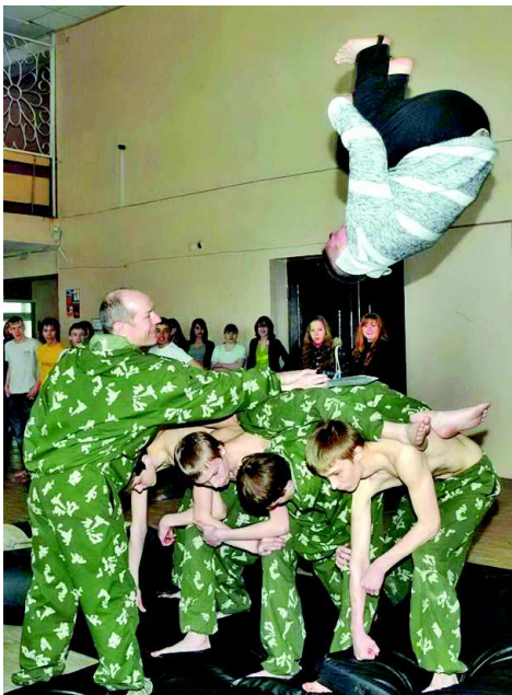
В полете - "саланговцы".