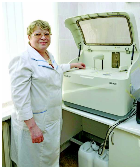
Демонстрация нового оборудования.

С открытием межмуниципальных центров (ММЦ) заработала ее трехуровневая модель: фельдшерско-акушерские пункты (ФАП), общеврачебные практики (ОВП) и городские больницы (ГБ). Для консультации медицинский работник ФАПа или ОВП может направить пациента, допустим, в межмуниципальный центр. Здесь работают специалисты более высокого уровня квалификации, применяются новые