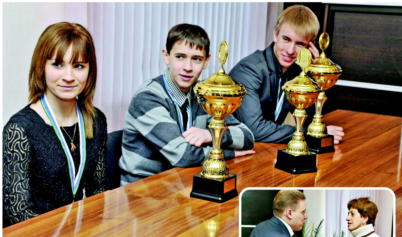
"Нас ждут новые старты".