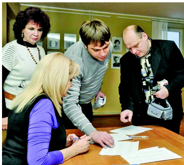
Председатели участковых комиссий на семинаре 5 февраля.