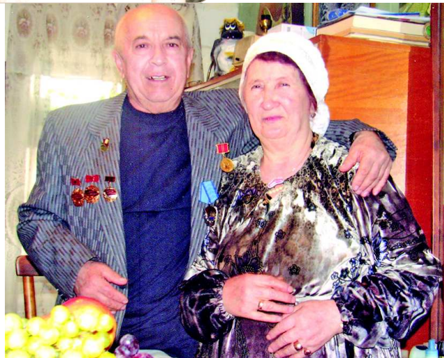
Золотые юбиляры в день 50-летия со дня свадьбы.

- Возвращаюсь - нет жены, в больницу увезли.