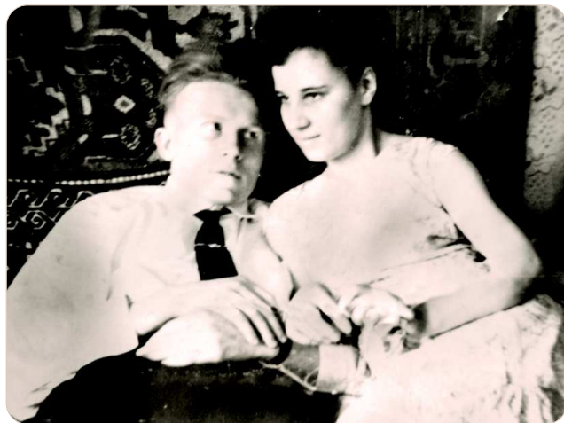
Как будто это было вчера...