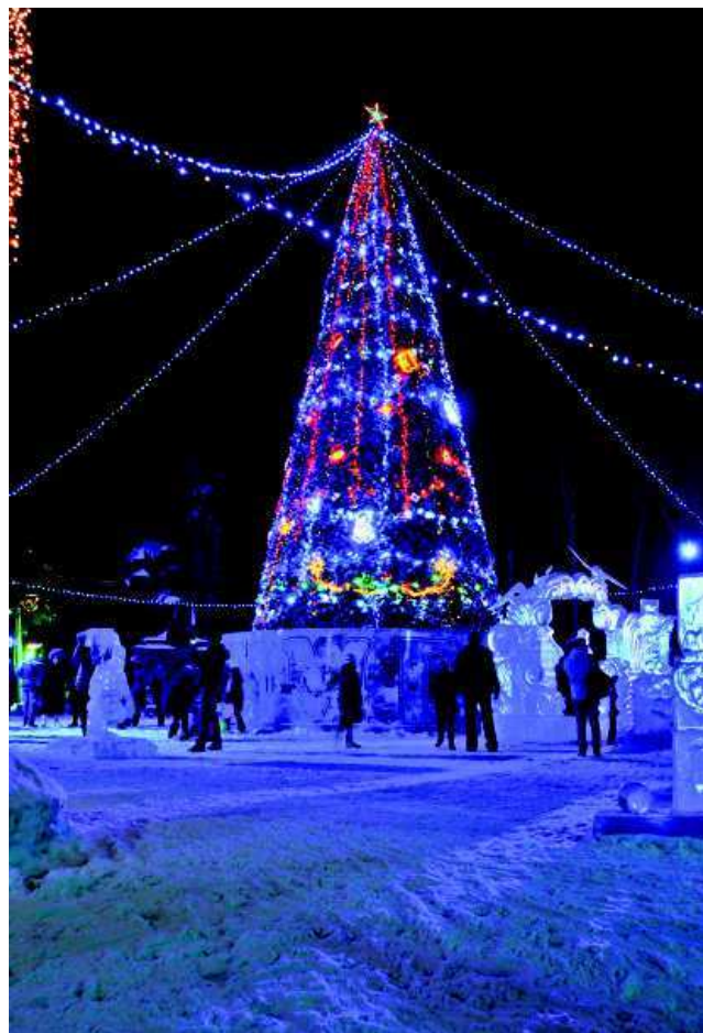
Зеленая красавица обосновалась в парке культуры и отдыха.