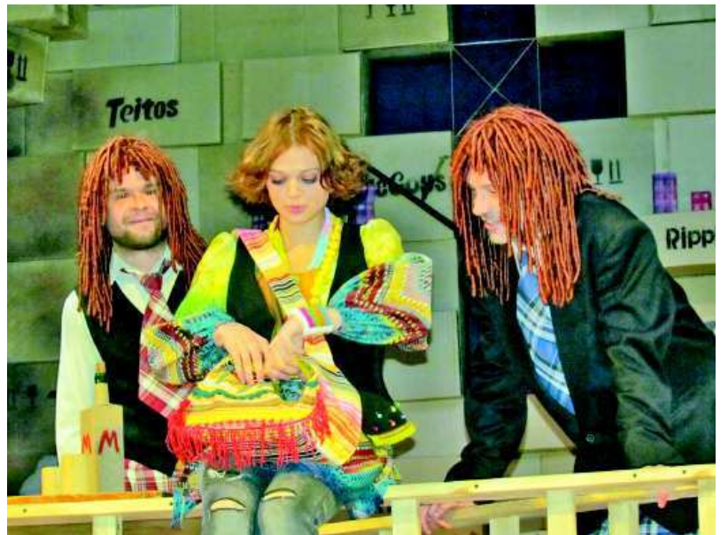
Спектакль "Сиротливый Запад".

мын..." зал вновь заполнился. Зрители долго не отпускали со сцены первоуральцев, несколько раз вызывая их "на бис".