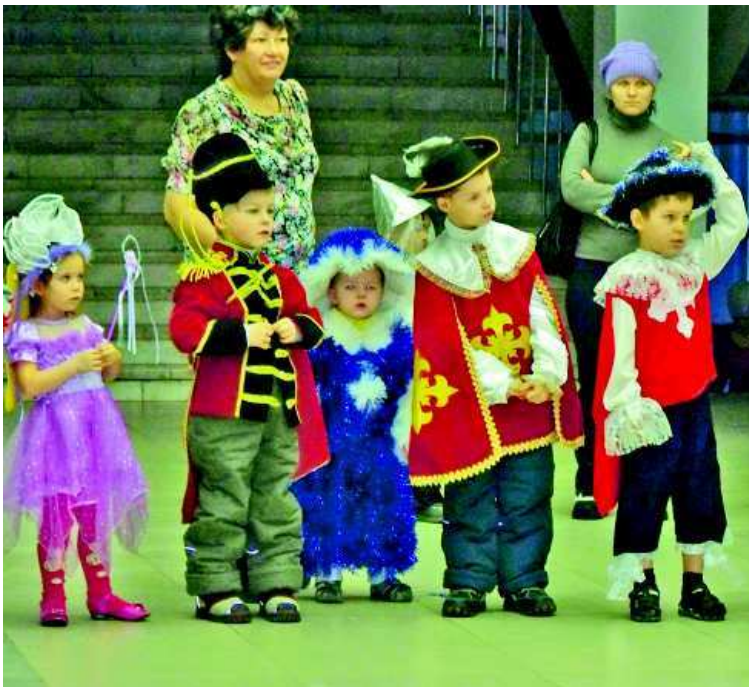
Для малышей хоровод вокруг зеленой красавицы стал хорошим подарком.

Улица Чкалова, 19, улица Строителей, 34. Просьбы открыть двери. Выезжали два спасателя. Помощь оказали.