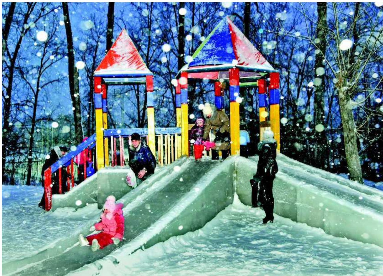
Малышня и взрослые с удовольствием катаются с горок.