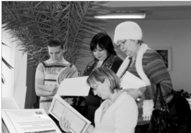
Педагоги Первоуральска активно знакомятся с работами своих коллег.

Представленные на выставке-конкурсе "Профессионализм педагога: как ценность в образовании" материалы отличались разнообразием. Это разнообразные методические разработки, методические рекомендации, справочники, фотоальбомы, электронные презентации, сборники заданий, рекомендации по организации летне-оздоровительной кампании, сборники задач и олимпиадных заданий, учебные пособия, поэти-