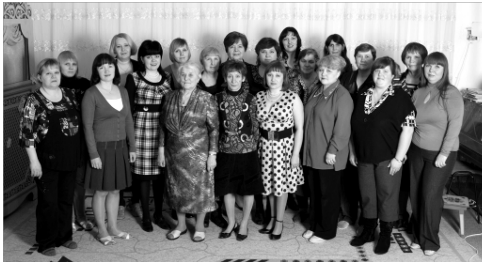
Дружный коллектив детского сада № 47.

С наилучшими пожеланиями родители воспитанников: АХУНОВЫ, ОРЛОВЫ, СПЕВАК, КАДНИКОВЫ, КРЫЛОВЫ, ЛИСТРАТКИНЫ.