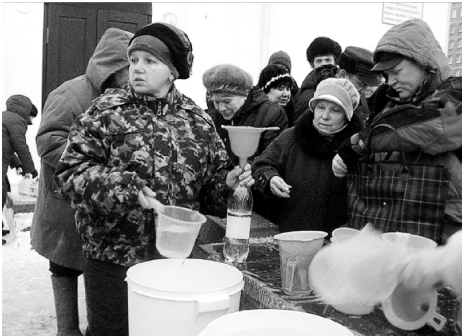
До такого - делать запасы воды - в поселке еще не дошли. Но новоуткинцы уже давно полагаются только на себя.