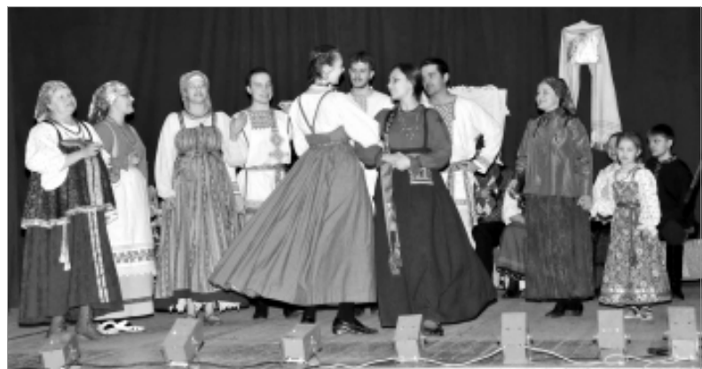
Молодежь легко освоила кадрили.

В ожидании кардинальных перемен работа по внутреннему ремонту продолжается. Сейчас в Народном доме хотят заменить пол, причем с учетом специфики здания нашли материал - толстые лиственничные доски. Осталось только где-то изыскать 25 - 30 тысяч рублей, чтобы заплатить за них. Может, неравнодушные откликнутся?