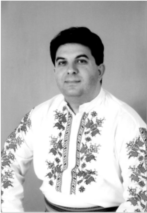
Данислав Кехайов - народный певец Болгарии.

- Люди старшего поколения помнят, что в советский период Первоуральск был го-