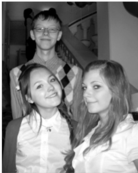
Первоуральская команда читателей.

Нельзя дать информацию обо всех или даже большинстве современных книг, этот обзор - маленькая толика того, что можно читать с удовольствием и с пользой для своего умственного и духовного развития.