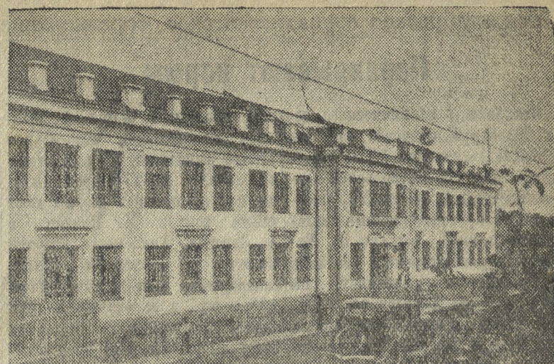
Первоуральская средняя школа № 10

Как передает японское агентство Домей Цусин, английское правительство известило Японию об открытии дороги Бирма-Китай. Эта шоссе-дорога, связывающая Китай с английской колонией Бирмой, была закрыта 3 месяца тому назад по настоятельным требованиям Японии. (ТАСС).