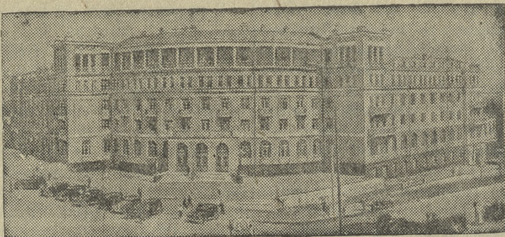
Вновь выстроенная центральная гостиница на улице имени Ленина в гор. Кирове.