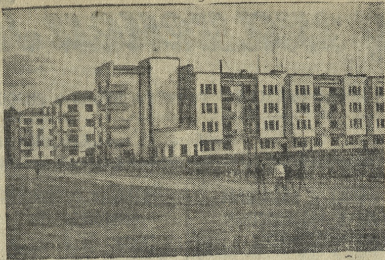
Вид на каменные дома в Соцгороде Новотрубного завода.