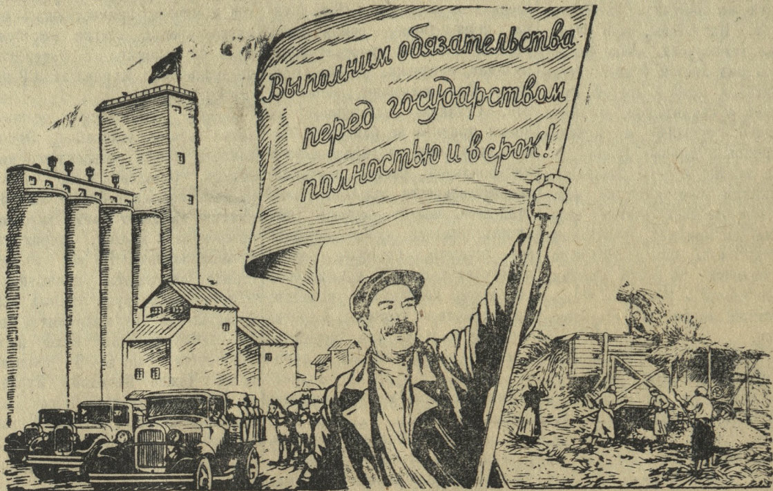
Рисунок В. Баркова и В. Лисевича

Заготовительные организации в свою очередь обязаны обеспечить бесперебойную приемку хлеба, самое надежное и бережное его хранение. Переход на новую систему заготовок значительно повысил ответственность работников на элеваторах, складах, сыпных пунктах. Каждый из этих работников должен помнить, что он является уполномоченным государством и во многом отвечает перед страной за успех заготовок и закупок сельскохозяйственных продуктов.