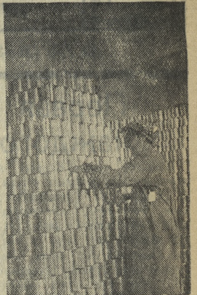
На складе готовой продукции беконноконсервной фабрики. За первое полугодие 1940 г. фабрика выполнила план на 209 процентов.

За год после прихода Красной Армии предприятия г. Львова значительно увеличили выпуск продукции, растут ряды ударников и стахановцев.