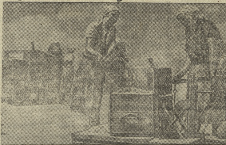
Очистка и взвешивание зерна

С первого дня уборки нового урожая колхоз «Радикское село» (Херсонского сельского района Николаевской области) хорошо организовал работу на току для сдачи государству высококачественного зерна.