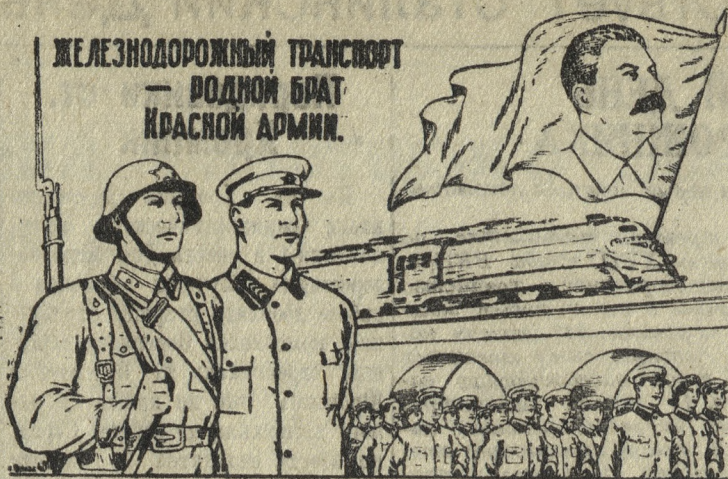
Рисунок Г. Валька.

Болгарские газеты опубликовали полный текст доклада товарища Молотова. Газета «Зора» напечатала доклад под заголовком: «Мирными средствами СССР занял прочную позицию в Европе».