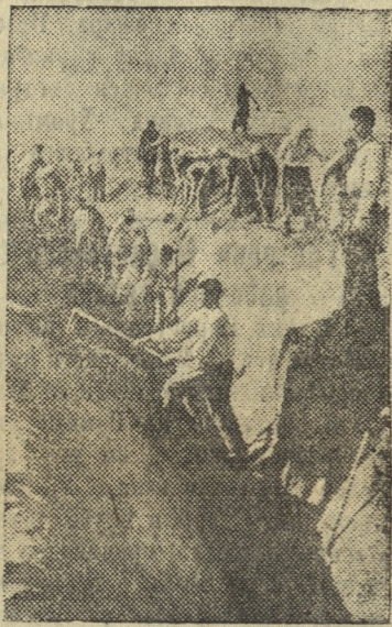
На строительстве канала.

По инициативе колхоза «Вторая пятилетка» (Зиянчуринский район, Чкаловская обл.) началось строительство большого оросительного канала. Главная магистраль канала протянется на 6 километров вдоль полей района. От нее пойдут многочисленные ответвления, дальше густая сеть арыков. Длина всей оросительной системы будет равна 60 километрам. Канал даст возможность оросить и обводнить несколько тысяч гектаров полей. Больше 400 колхозников района принимают участие в строительстве канала.