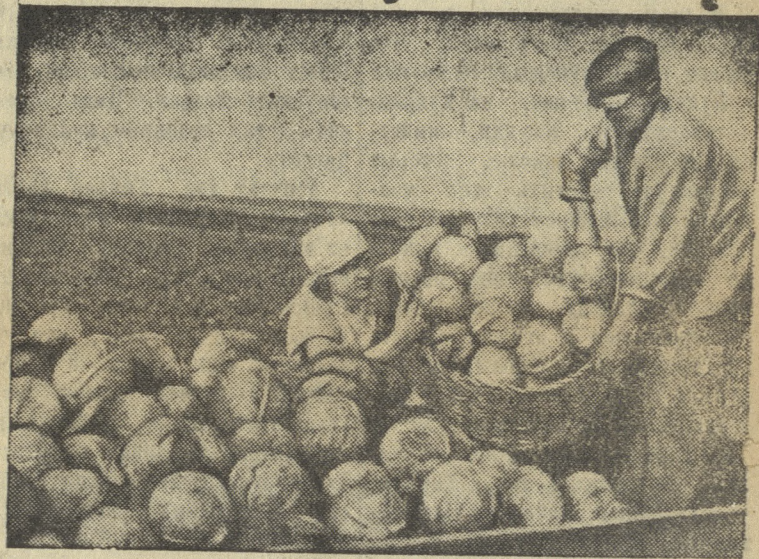
Погрузка свежей капусты колхозниками сельхозартели имени Крупской (Буденновский район, Орджоникидзевский край) для отправки на заготовительный пункт.