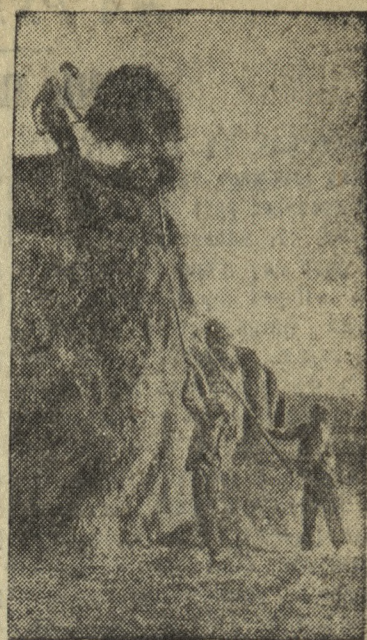
Скирдование сена — людерны в колхозе имени Димитрова (Мечетинский район, Ростовская область).

зав. бюро организации труда трубопрокатного цеха Новотрубного завода.