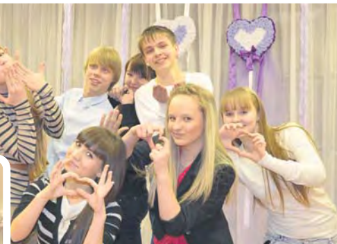
Мальчишки тоже учились делать валентинки

Первый молодежный информационный портал Сысертского района