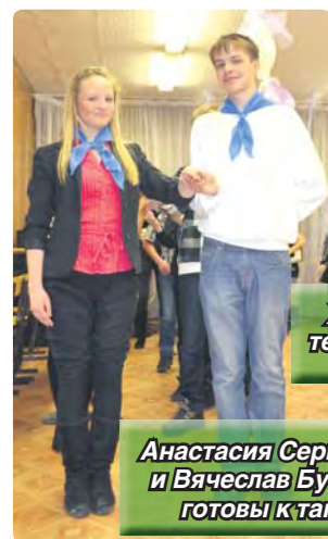
Живая картинка на тему Дня влюбленных

Вечерний «Бал влюбленных» увлек и окуталных танцоров музыкой, веселыми и романтичными играми и забавами, новыми знакомствами и симпатиями.