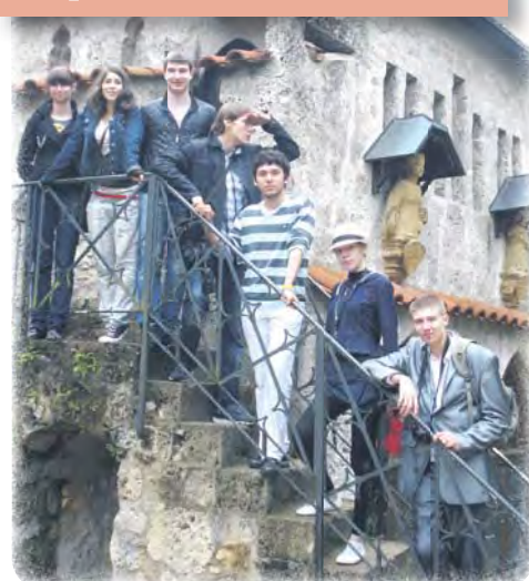
Группа юных архитекторов в окрестностях замка Лихтенштейн

архитекторы. Теперь это место ждут кардинальные перемены. В планах собственника: