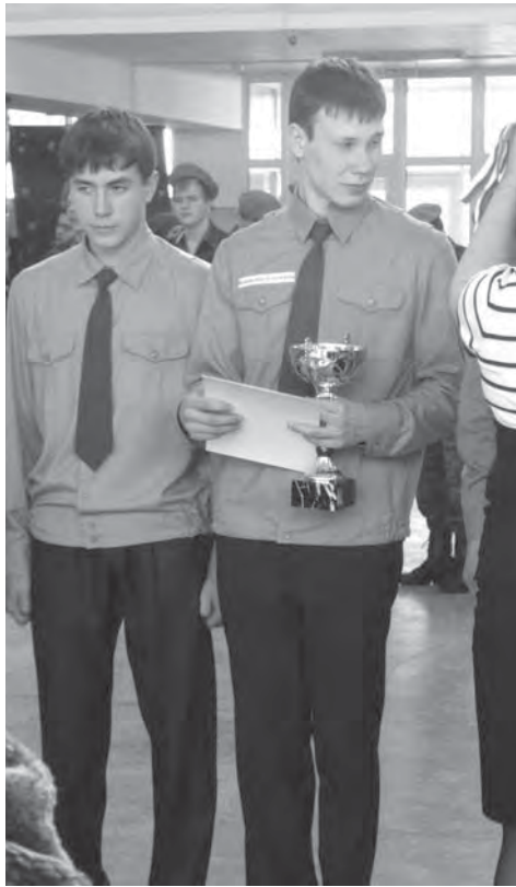
рыми – сысертские ребята (школа N 23), а третье место завоевали юноши из «бобровки».