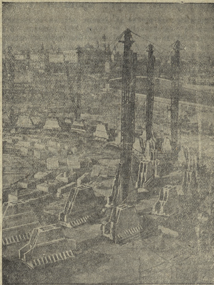
На строительстве Дворца Советов (Москва). (Снимок сделан 9 мая 1940 г.)

Сообщают также, что Муссолини отказался принять очередное послание Президента США Рузвельта, который, как известно, пытается отговорить Муссолини от вмешательства в войну. (ТАСС).