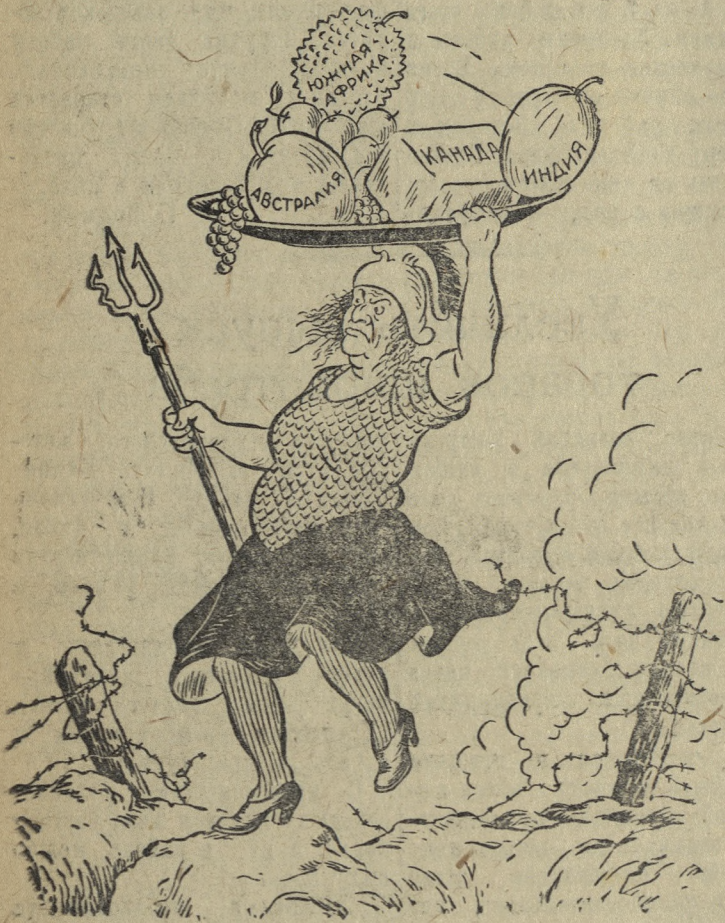
Британская империя на ухабах войны. Рис. В. Лисевича.

Как сообщает агентство Рейтер, в Лондоне официально объявлено, что войска союзников вчера вечером захватили Нарвик.