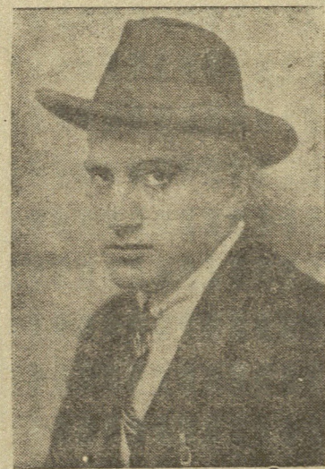
В. В. Маяковский.

Машинист все свои знания, кривоносский опыт передает товарищам по работе. 47 человек бывших его учеников работают теперь помощниками машинистов и машинистами. Далеко много ценных рационализаторских предложений.