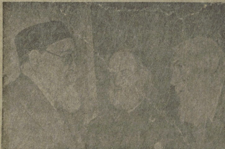
На снимке (слева направо): академики А. Е. Фаворский, А. Н. Крылов и А. Н. Бах.

В Доме ученых (Москва) состоялось чествование химика академика А. Е. Фаворского в связи с 80-летием со дня его рождения и 55-летием научно-педагогической деятельности.