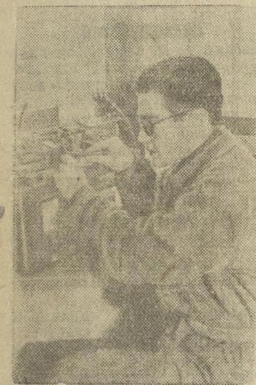
В радио-мастерской кооперативной артели в городе Барановичи.