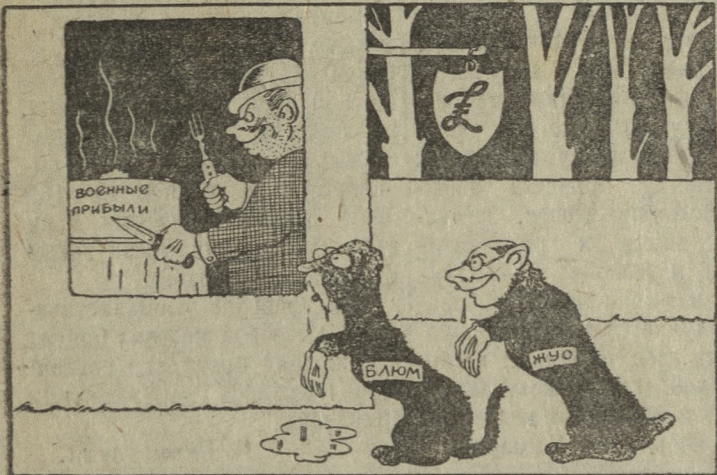
Рис. М. Отарова.