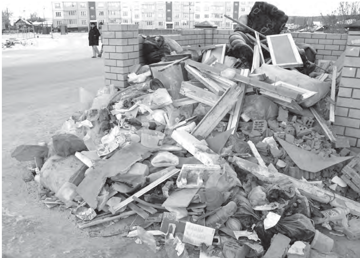
По мнению сысертяцев, это - крупногабаритный мусор

В Сысерти же пока коммунальная служба пытается раздельно собирать крупногабаритный мусор и бытовой. Построили даже специальные контейнерные площадки с «пристройями» для крупногабаритного мусора. И что же? Да ничего! Нам, сысертякам, что называется, по фигу мороз! Наблюдаю за контейнерной