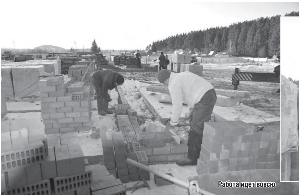
Работа идет вовсю