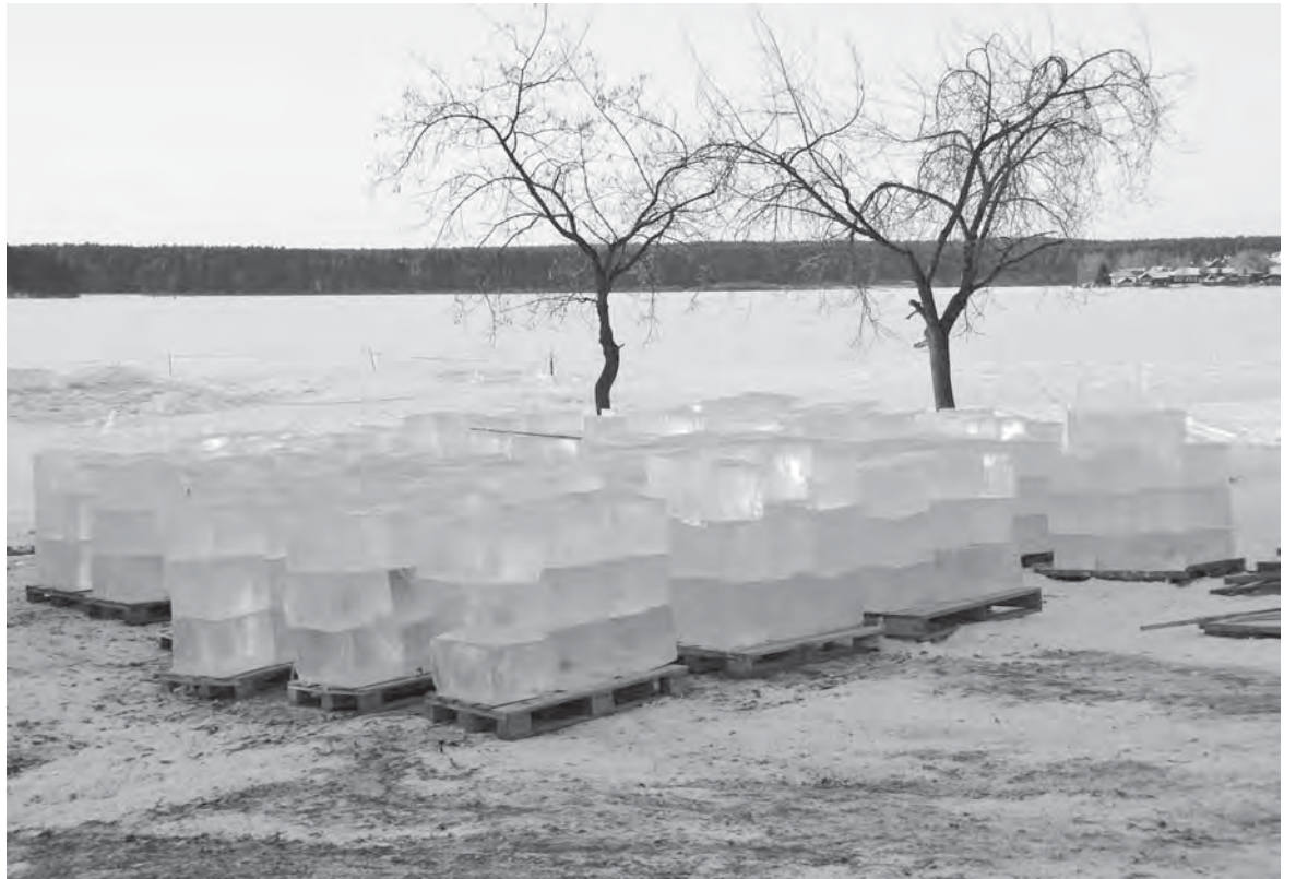
Скоро эти штабели льда превратятся в сказку