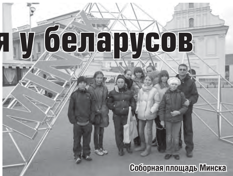
Соборная площадь Минска

историко-культурный комплекс «Линия Сталина». Здесь восстановили оборонительные сооружения середины XX века, разместили военную технику разных эпох, проводят также исторические реконструкции. На территории комплекса мы посетили артиллерийский полукапонир и пулеметный ДОТ, увидели противотанковые и противопехотные заграждения, прошли по окопам и сфотографировались у современной боевой техники. Очень вкусным оказался настоящий солдатский обед - борщ и гречневая каша.