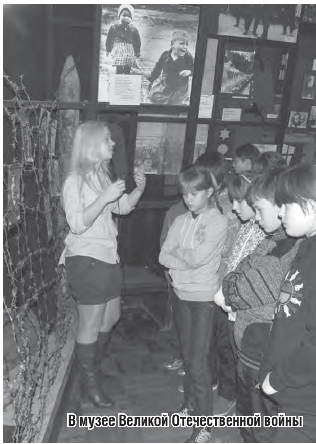
В музее Великой Отечественной войны