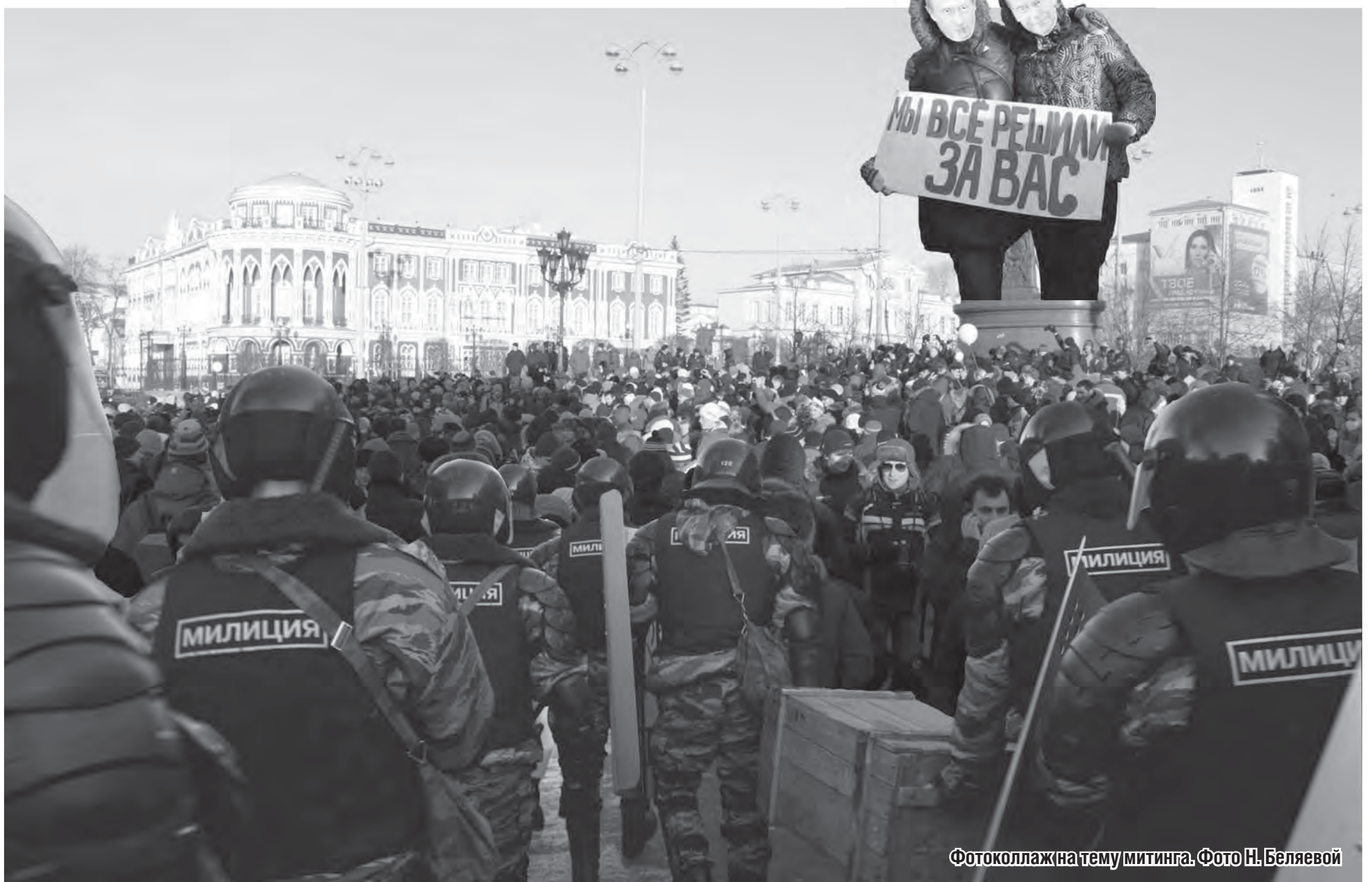
Фотоколлаж на тему митинга.

Находясь посреди огромной толпы на площади Труда в Екатеринбурге, я наблюдала за растерзанием плюшевой игрушки. Толпа радостно улюлюкала, медведь с заклеенным ртом безвольно висел на палке, а я мысленно переделывала строчки детского стишка: «Посадили мишку на кол, оторвут еще и лапу, а потом его сожгут...». Что это было? 10 декабря по всей России прокатилась волна митингов несогласных с результатами выборов в Государственную Думу.