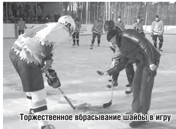
Торжественное вбрасывание шайбы в игру

Матч начался атаками хозяев. Особенно ощутимым было преимущество «Металлурга» когда на лед вышла первая пятёрка: