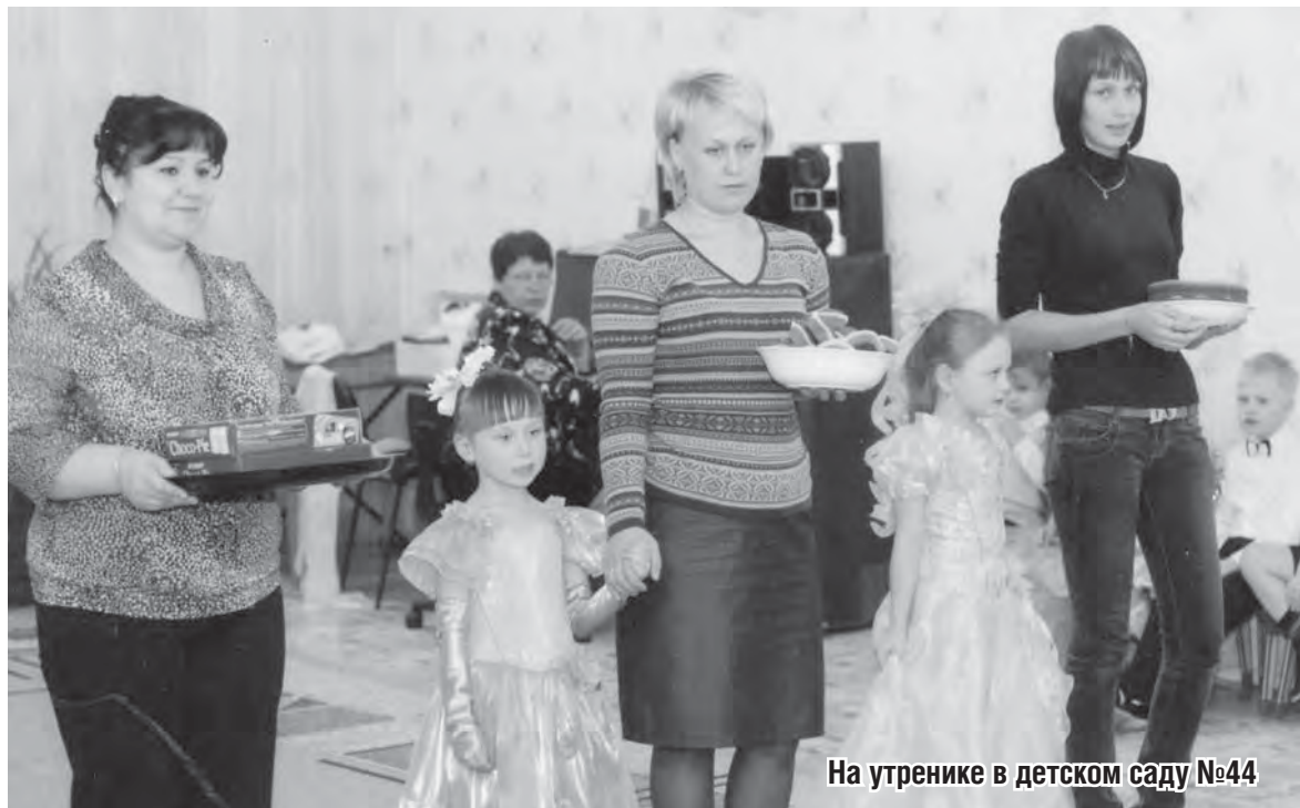
На утреннике в детском саду №44