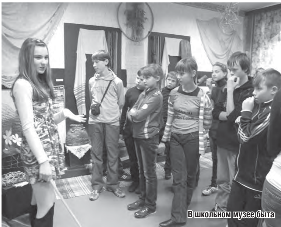
В школьном музее быта