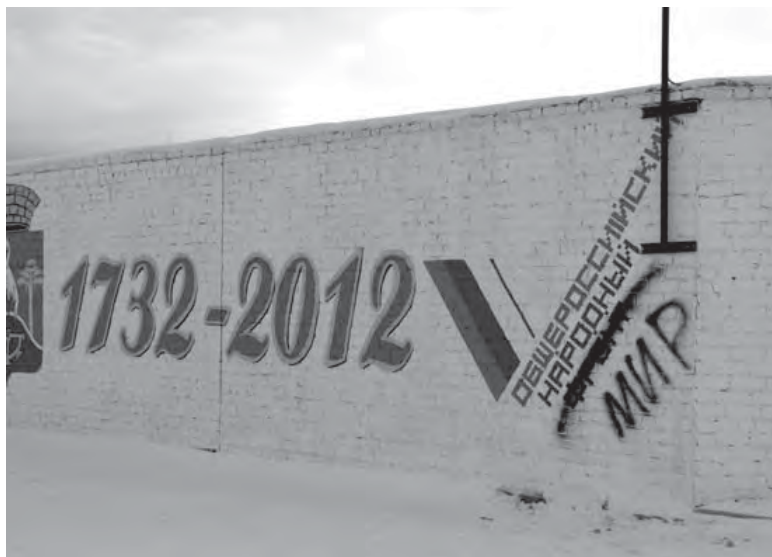
«попортил» в принципе красивый рисунок на стене около военкомата в Сысерти? Идея, между

Видимо, так думаю не только я. Посмотрите на фото. Кто так