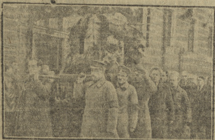
На снимке: Вынос траурных носилок с урной из здания Московского Совета.